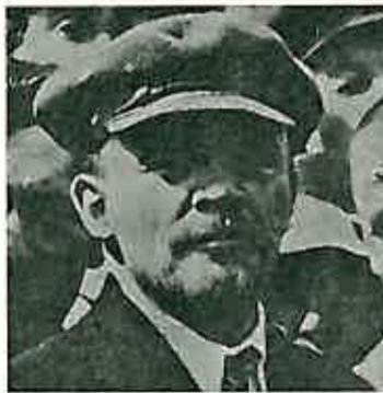
Vladimir Iljič Lenjin

U zimi 1918. na 1919. godinu vodile su se teške borbe na svim frontovima, jer su imperijalisti Amerike, Engleske, Francuske i Japana navalili velikim vojnim snagama na Sovjetski Savez. Njihove su se vojske iskrcavale u Odesi na Krimu, u Zakavkazu, Sred-