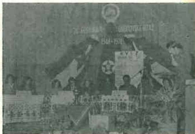
Voditelj postavlja pitanja ekipama u Lupoglavu