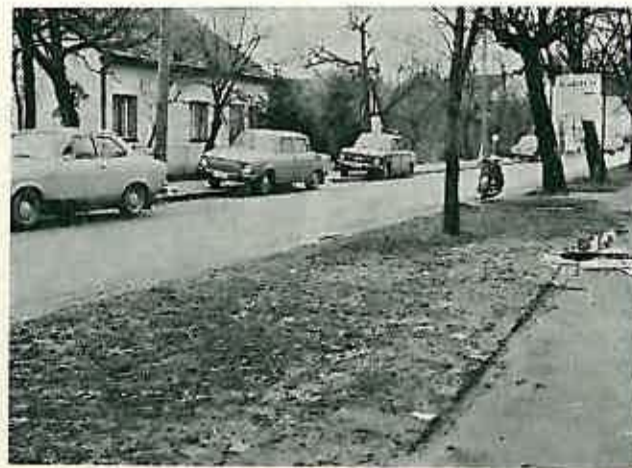
Ovako izgledaju naše »zelene« površine u Dugom Selu