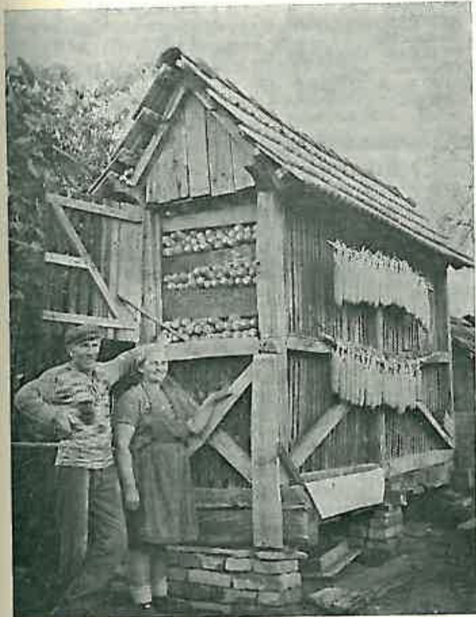
Mijo i Miika Sevc iz Prevlake, članovi „Kluba 100“, pred svojim kukuružnjakom, snimljeni nakon prošlogodišnje odlične berbe kukuruza