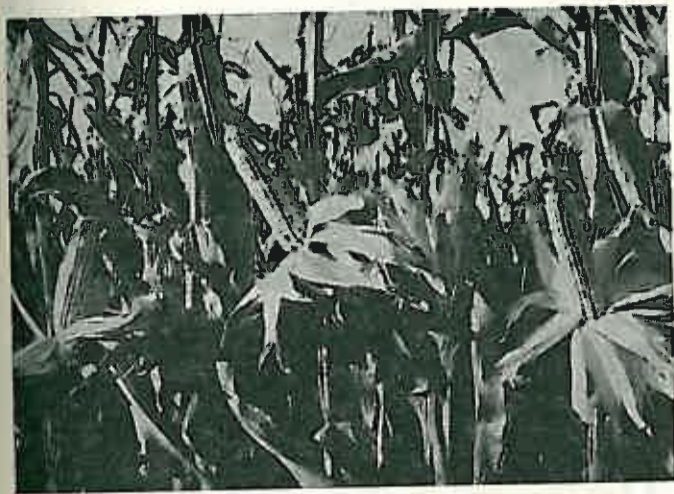
Ovako je izgledao prošlogodišnji rekordni urod kukuruza na parcelama članova „Kluba 100“ u dugoselskoj općini