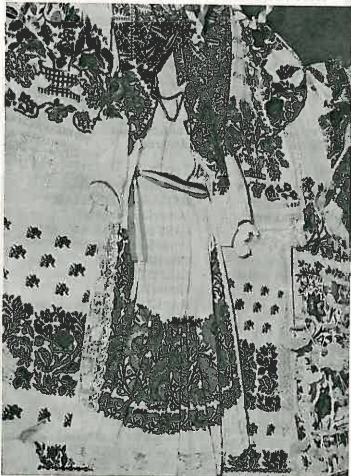
Izloženi ručni radovi žena iz Preseke

DUGOSELKA KRONIKA — glasilo društveno-političkih organizacija općine Dugo Selo. Izlazi svakog 25. u mjesecu. Izdaje: Narodno sveučilište Dugo Selo, Ulica braće Bobinca br. 15. Glavni i odgovorni urednik: IVAN VRANIĆ, Dugo Selo, Ulica Slavka Kolara 5. Tehnički urednik: Ernest Fišer. Uređuje redakcijski odbor: Belizar Božiković, Josip Trupeć, Ivan Vrančić, Pavao Škrlec, Josip Horvat, Ivica Kulaš, Hrvoje Medimorec i Rudolf Galovec. Tisak: »ZRINSKI« Čakovec. Cijena pojednog broja 1,00 dinar. Pretplatna tromjesečna 3,00 dinara, polugodišnja 6,00 dinara, godišnja 12,00 dinara. Pretplate se šalju na žiro-račun Narodnog sveučilišta Dugo Selo br. 30111-603-6553 kod SDK Zagreb — ekspozitura Dugo Selo.