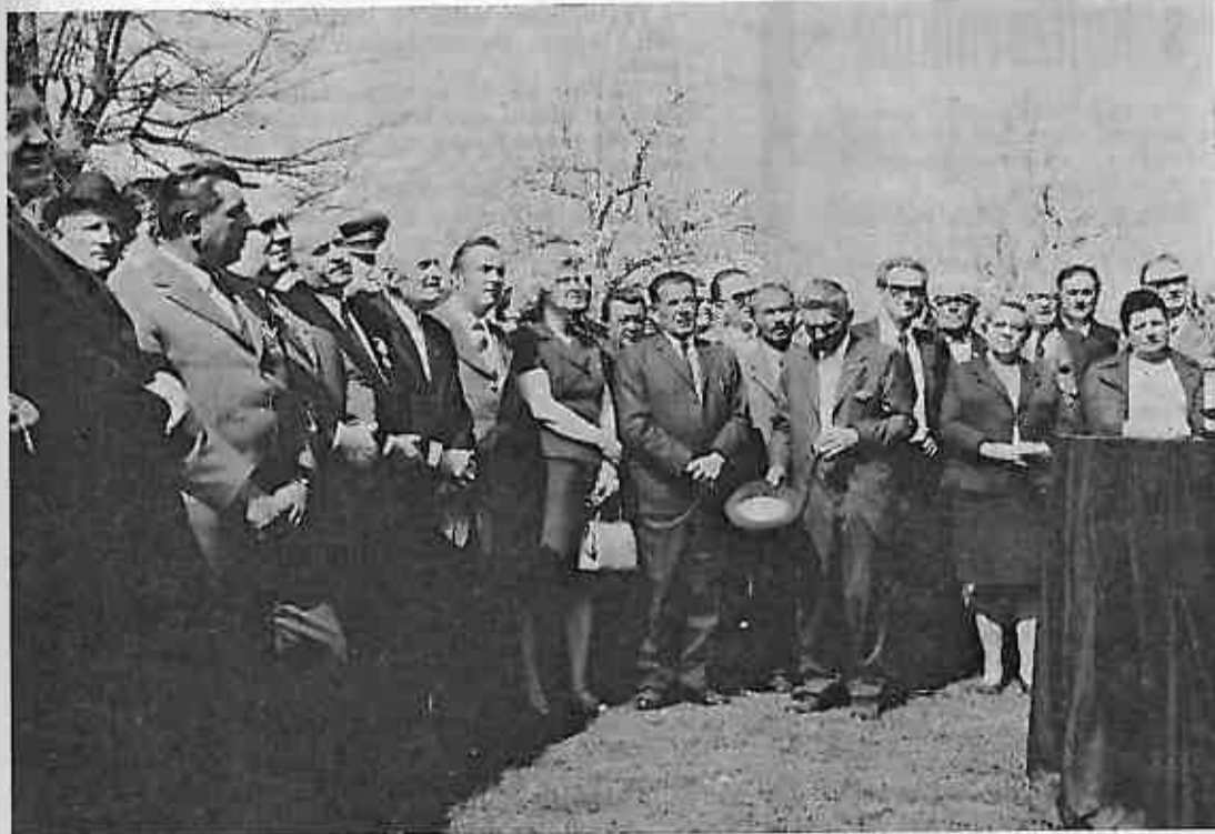
Iako je vladala ljetna vrućina, sudionici proslave su s velikom pažnjom pratili program svečanosti u Oborovu