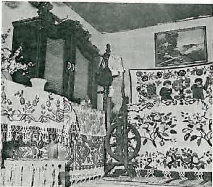
Izloženi ručni radovi žena iz Građeca

Žene iz aktiva u selima Rugvica, Štakorovec, Ostrna i Sop — Hruščica organizirale su zabave, prigodom kojih su također izložile vrijedne rukotvorine svojih sela, kao i svoje vlastite, a kojima su uljepšale zidove domova u kojima