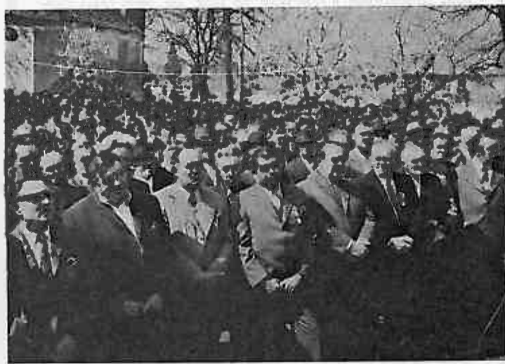
Skolsko dvorište u Oborovu bilo je premalo da primi sve sudionike svečanosti