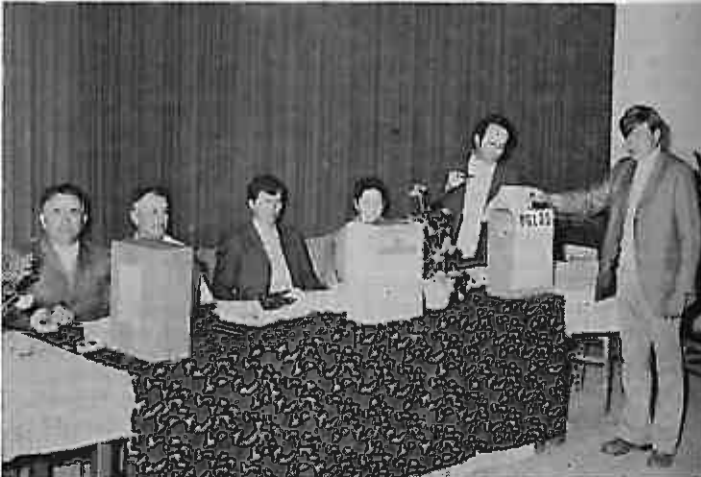
Detalj sa birališta u Jezevu