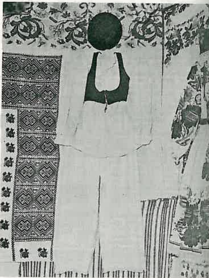
Detalj s izložbe rukotvorina u čast Dana žena