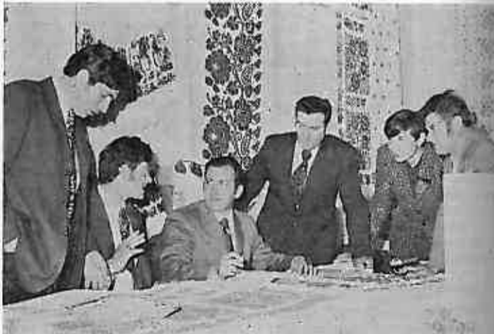
Biračko mjesto u Gračecu bilo je estetski dekorirano narodnim vezovima i nošnjama