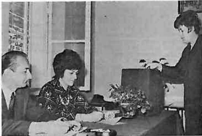
Glasanje za delegate u svečano uređenoj prostoriji Vodne zajednice u Dugom Selu