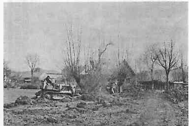
Leveliranje zemljišta na mjestu gdje će se graditi nova stambena višekatnica