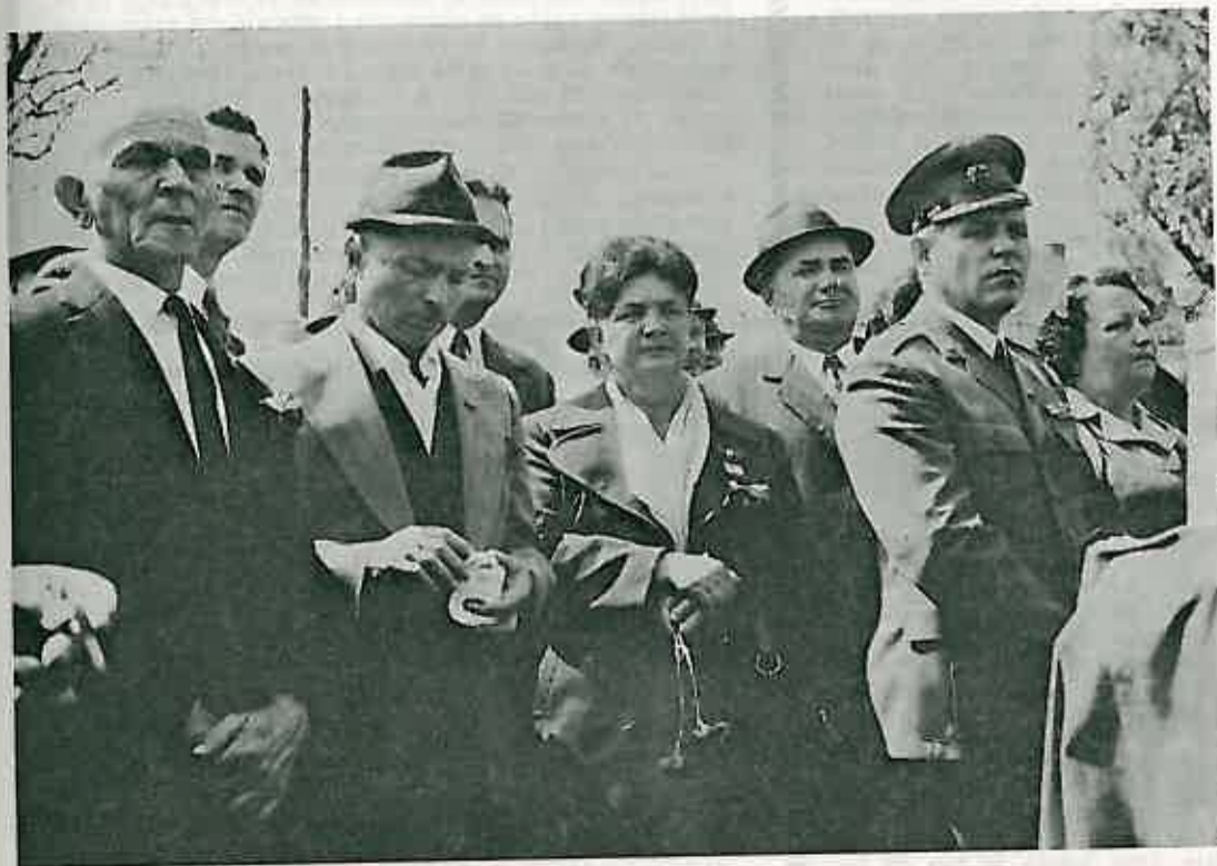
Grupa preživjelih boraca — sudionika oborovske bitke