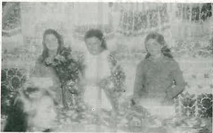
I žene Donjeg Dvorišća proslavile su na svećan način svoj praznik

Kao svake godine, tako je i ove Aktiv žena Dugog Sela organizirao skupljanje dobrovoljnih priloga za jednu od humanih akcija, koja je ove go-