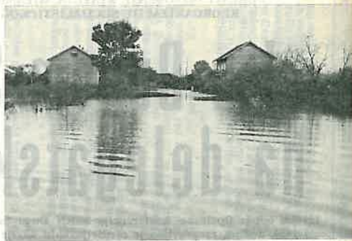
Ovako je izgledao ulaz u Oborovo za vrijeme katastrofalne poplave u dugoselskom kraju

Između Okunščaka i Narta, na putu, došlo je do prepirke. Mještani iz Okunščaka htjeli su put prekupati, smatrajući