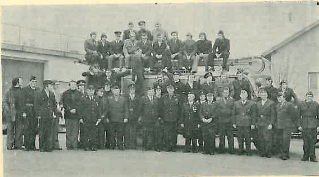
Novi vatrogasni podoficiri na završetku tečaja.