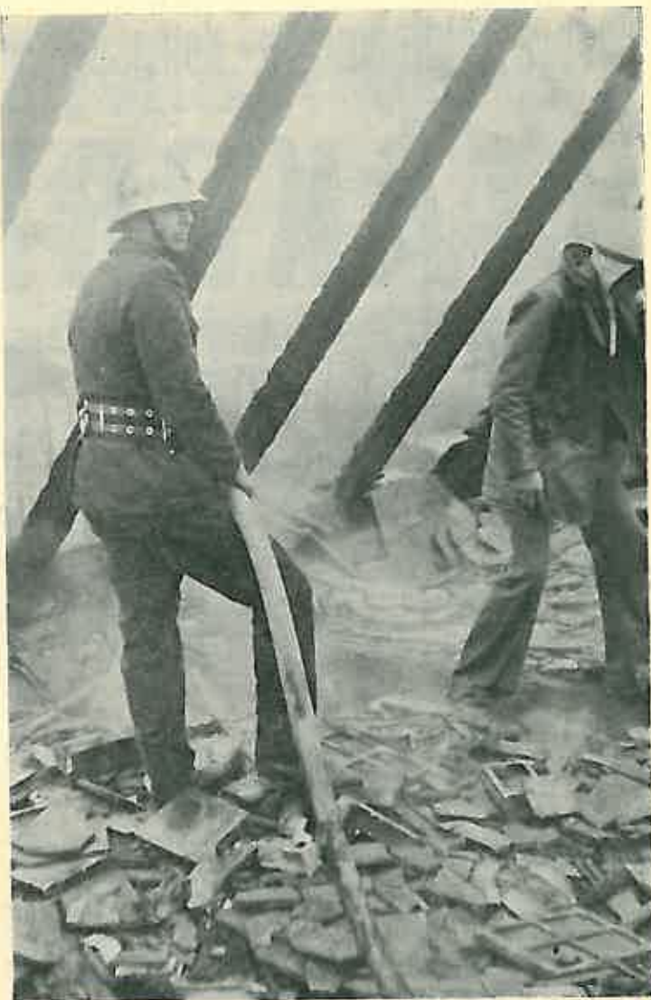
Vatrogasci često i svoj život izlažu opasnosti!

Za vatrogasne organizacije zainteresirana je šira društvena zajednica i općenarodna obrana. Financijska sredstva uvijek se osiguravaju na nivou općine. Vatrogasci nisu danas dužni da hodaju od kuće do kuće prositi za dinar, ali mogu obilaziti kuće i stanove u cilju vatrogasne prevencije i da se unaprijed isključuju i onemogućuju eventualni uzročnik požara.