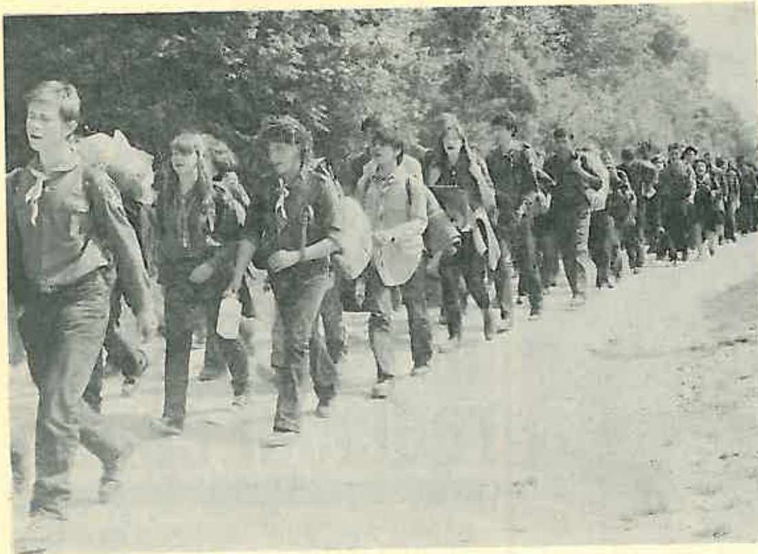
Izviđači u akciji ...