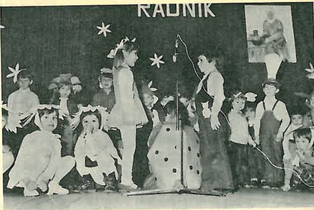
DJEČJI VRTIĆ JE OTVOREN — DE FACTO