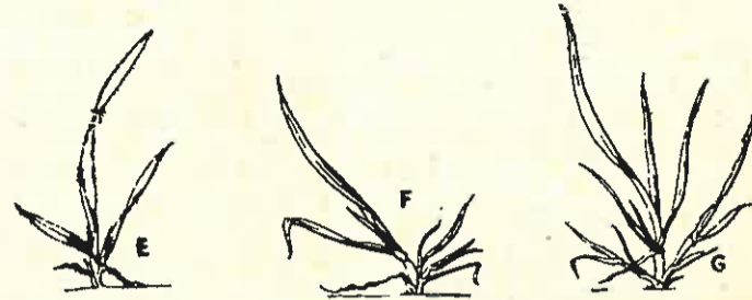
E = Početak bokorenja F = Bokorenje G = Završetak bokorenja

Faze razvoja pšenice u kojima se može primeniti u 46 DP — FLUID