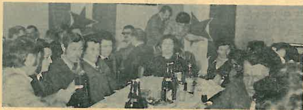
Odlikovani građani imali su zajedničku zakusku