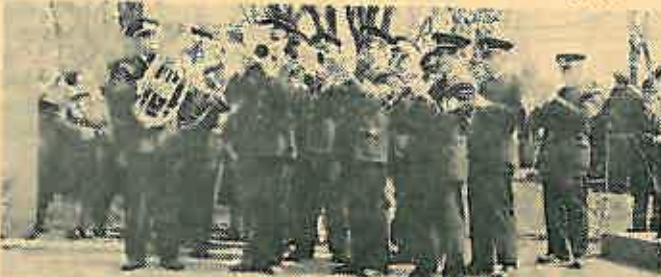
Vatrogasna limena glazba iz Dugog Sela u Oborovu