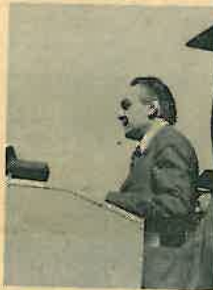
Pero Car za govornicom u Oborovu