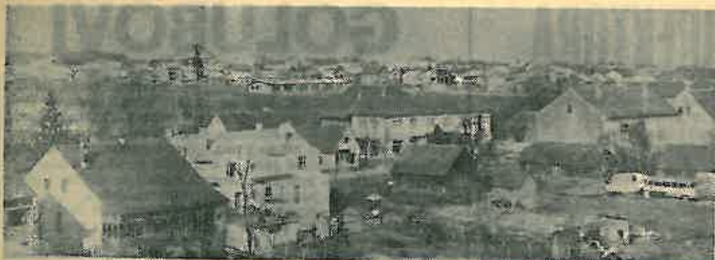
Novo naselje — pogled s nove četverokatnice u Cobovićevo