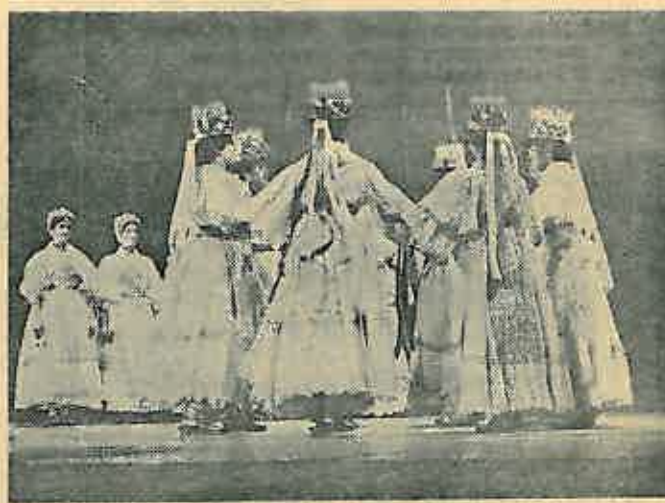
Na slici su »Slavonske kraljice« Folklornog ansambla Lado Recital omladine i vojnika