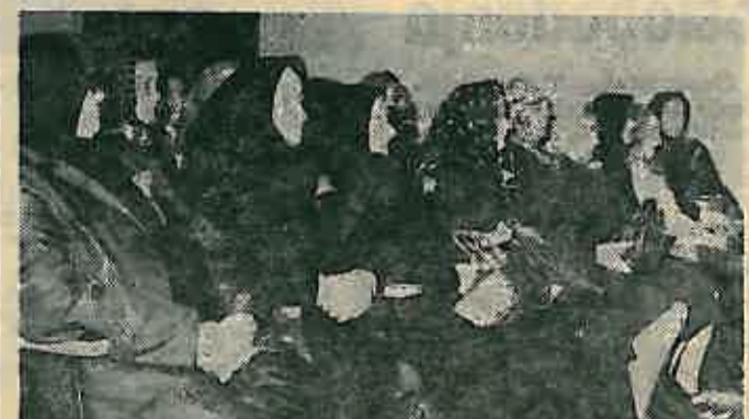
čelnice NOB i majke palih boraca na svečanoj akademiji 1973.

slobodu, bratstvo i jedinstvo, za novu revolucionarnu narodnu vlast.