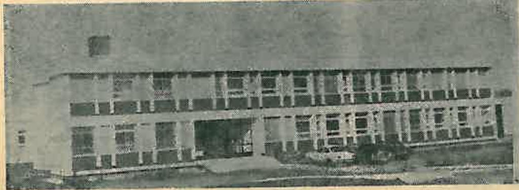
Poljoprivredni institut u Rugvici