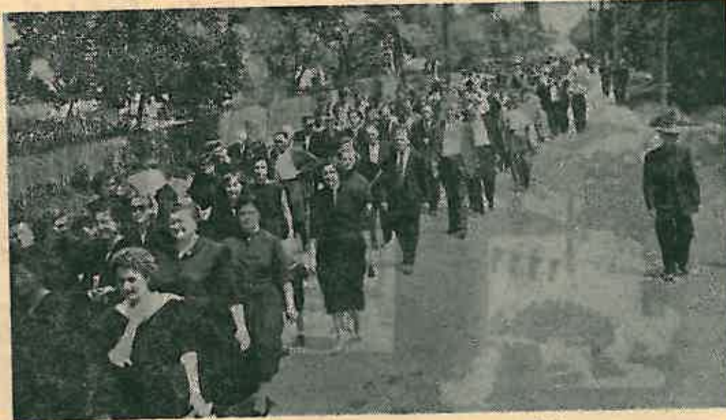
Gradani prate svoje drugove na Martin 1945.