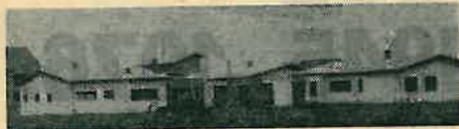
Novi dječji vrtić još ne radi punim kapacitetom

Gotovo u svakom selu novi društveni domovi, nove osmogodišnje škole u Dugom Selu i Rugvici, 1945. samo 3 sela u našoj općini imali su električnu rasvjetu, a do 1955. godine dakle za prvih 10 godina izgradnje naše zemlje u slobodi elektrificirano je i posljednje selo u našoj općini. 1945. godine imali smo samo 4 kilometra betonske ceste (Dugo Selo) a