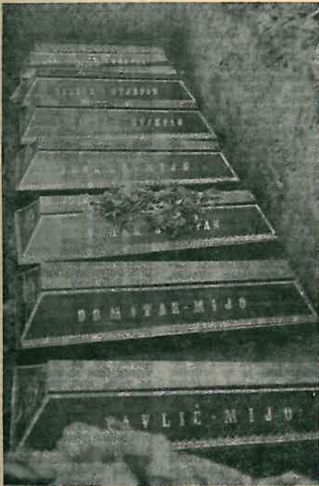
U zajedničkoj grobnici na Martinu