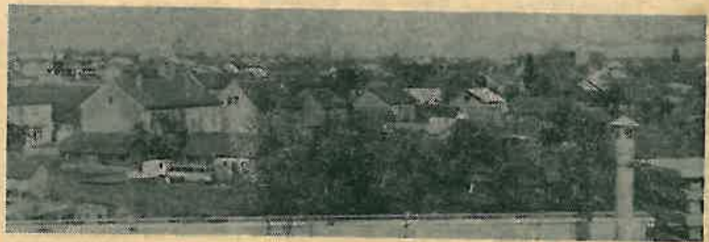
Panorama Dugog Sela neprekidno se mijenja ...