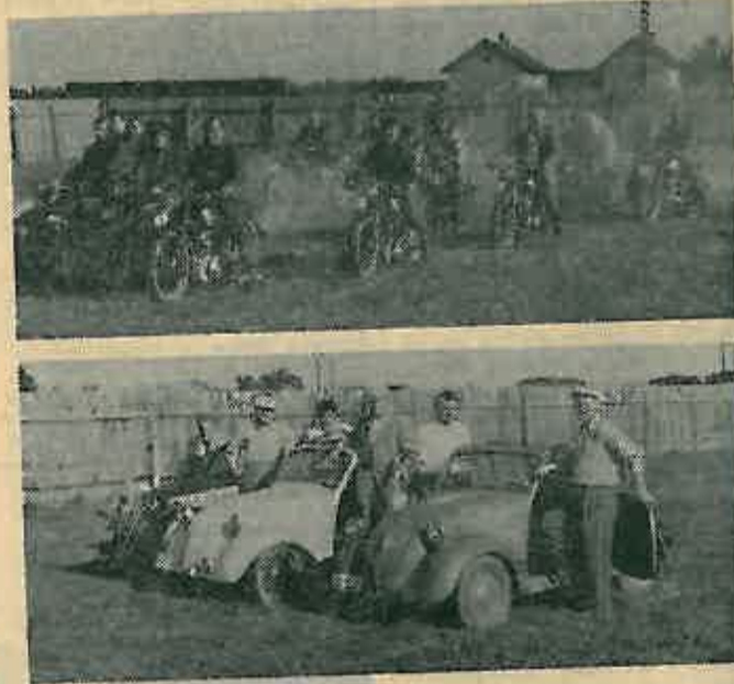
Obadviije fotografije su iz 1934. godine

DUGOSELSKA KRONIKA — glasilo društveno-političkih organizacija općine Dugo Selo. Izlazi svakog 16. i 23. u mjesecu. Izdavači: Narodno sveučilište Dugo Selo, Ulica braće Bobinec 15, tel. 73-319. Glavni i odgovorni urednik: IVAN VRA- NIĆ, Dugo Selo, Ulica Slavka Kolara 5. Urednik lista: STJE- PAN KOVAČ, Dugo Selo, Ulica Ivana Gorana Kovačića 6. Uređuje urednički odbor: Ivan Vranić, Stjepan Kovač, Kru- noslav Jakopović, Dragica Pjevac, Stjepan Turčinec, Dragu- tin Jakić, Đurđa Babić i Josip Horvat. Tiskar: IBG — tiskara »Zagreb«, Zagreb, Preradovićeve 21—23. Cijena pojedinom bro- ju 2,00 dinara. Pretplata tromjesečna 15,00 dinara, polugodiš- nja 30,00, godišnja 60 dinara (u pretplatu je uračunata i po- nja 30,00, godišnja 60 dinara na žiro-račun Narodnog sveučili- štarina). Pretplate se šalju na žiro-račun Narodnog sveučili- šta Dugo Selo br. 30111-603-653 kod SDK Zagreba — ekspozit- tura Dugo Selo. Rukopisi i fotografije se ne vraćaju.