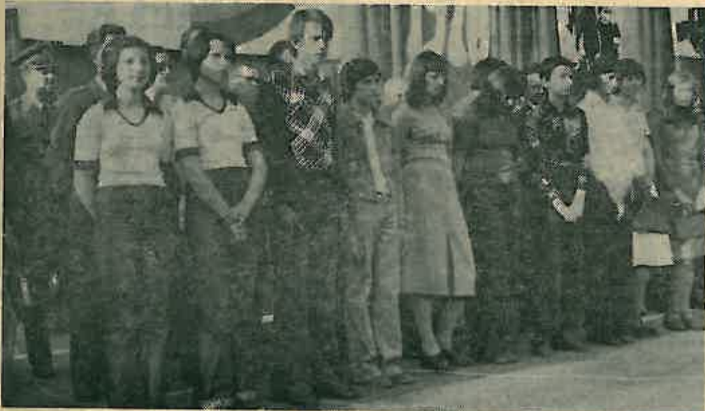
Oni su poslali svoje radove za Nagradu oslobođenja

Nagrada oslobođenja Dugog Sela dodjeljuje se u vidu 15 dnevnog ljetovanja na moru i diplome kao trajni dokument o osvojenoj nagradi.