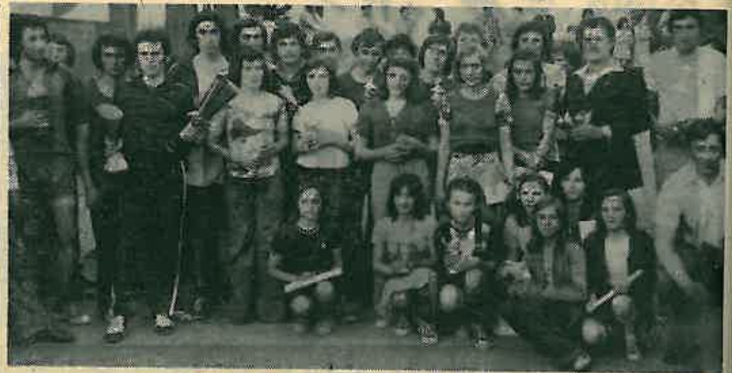
Pobjednici svih kategorija na Treći oslobođenja