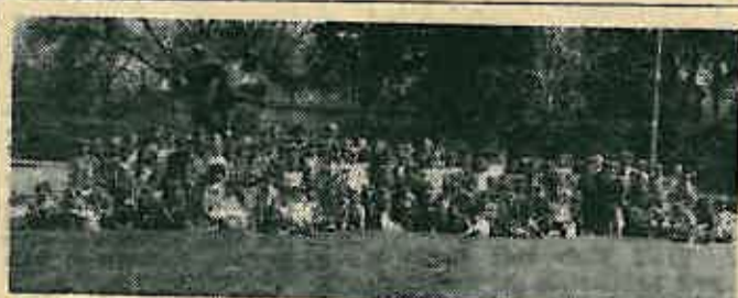
Učenici drugih razreda iz Dugog Sela posjetili su početkom svibnja Memorijalnu izložbu u Oborovu