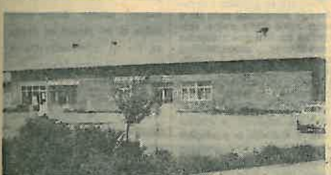
Dom u Oborovskim Novakima