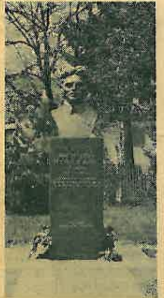
Spomen bista Stjepanu Bobincu

Drugi dan proslave odvijao se pred školom gdje je uz bogati program učenika otkrivena spomen bista narodnom heroju Stjepanu Bobincu Sumskom, u prisustvu brojnih građana, armije i rodbine Sumskog. O revolucionarnom putu i životu Sumskog govorio je Branko Struk, prvoborac ovog kraja koji se osobno poznao sa Sumskim. Svečanost pred školom na dan otkrivanja biste bila je bogata kulturno umjetničkim programom