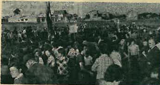
Na startu je bila prava košnica...