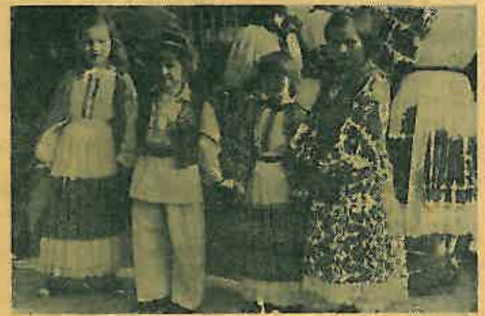
Na čelu povorke