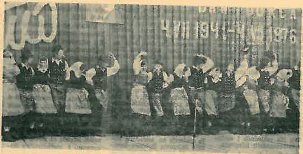
Veze s KUD iz Čirkovca treba i dalje održavati