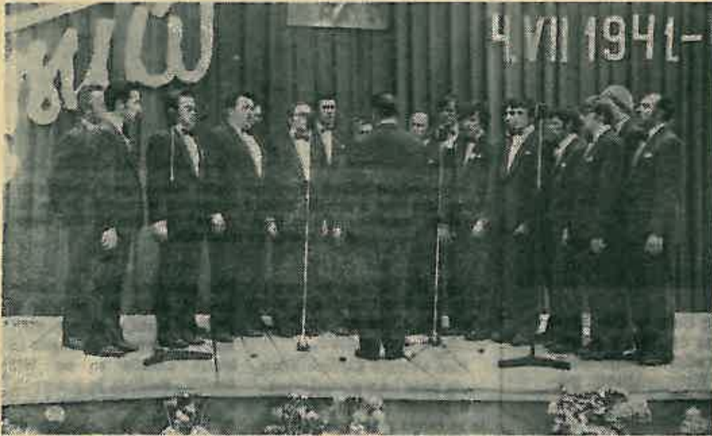
Zbor koruških Slovenaca na pozornici