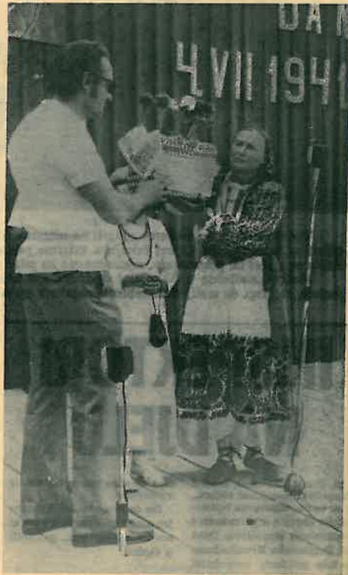
Žene iz Oborova pripremile su prigodan poklon