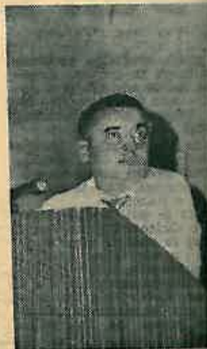
način utječe na društveno politička kretanja uopće.

U svojem predavanju drug Lalić se najviše zadržao na vjerskim zajednicama u našoj Republici, kao i njihovom radu koji na bilo koji