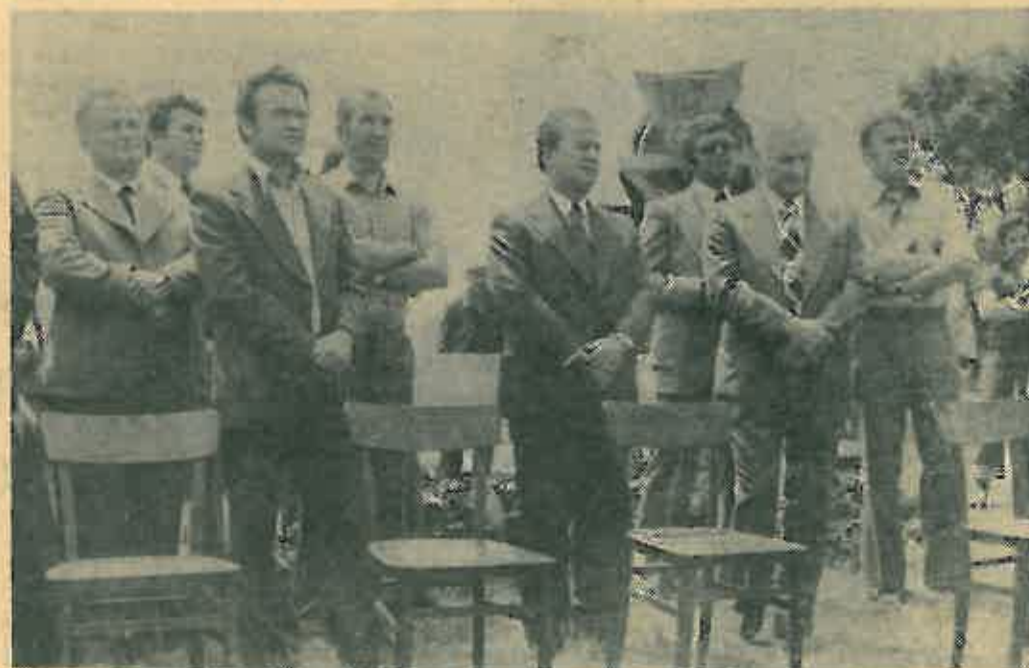
Svečanom polaganju kamena temeljca za novu hladnjaču, prisustvovala je i drug Jakov Sirotković, predsjednik Izvršnog vijeća Sabora SRH