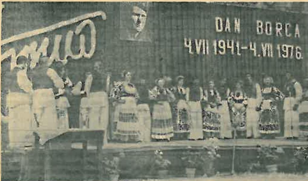
Folkloriši Seljačke sloge iz Lupoglava