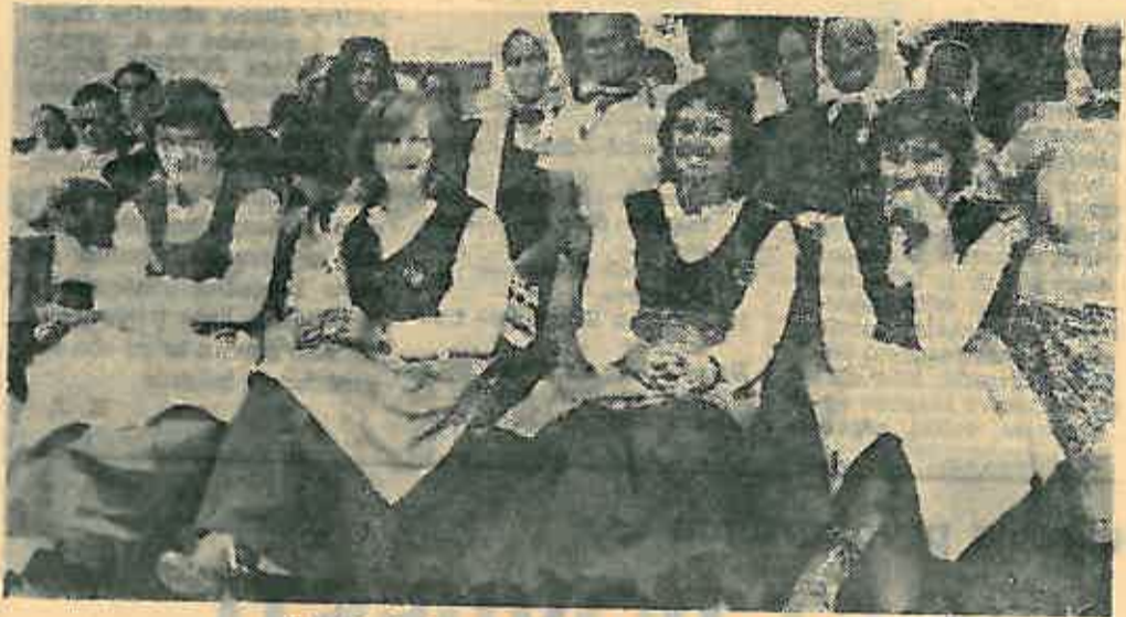
Dok drugi plešu, djevojke iz Slovenije gledaju