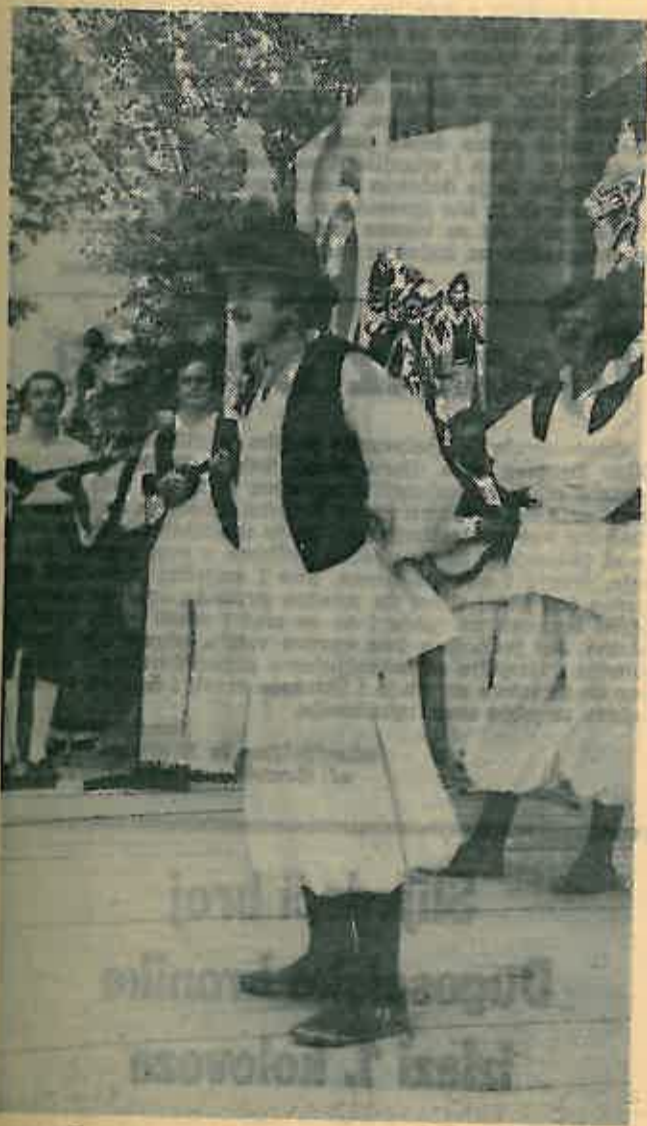
Dosta napora trebalo je uložiti za ovu točku

provođenju politike koju ona utvrdi i za izvršavanje propisa i akata skupštine.