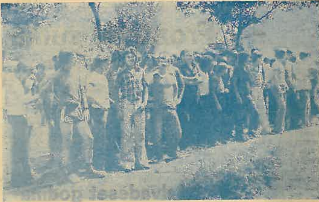
Učesnici Omladinske sportske olimpijade