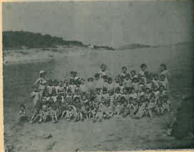
Da je tako cijele godine...