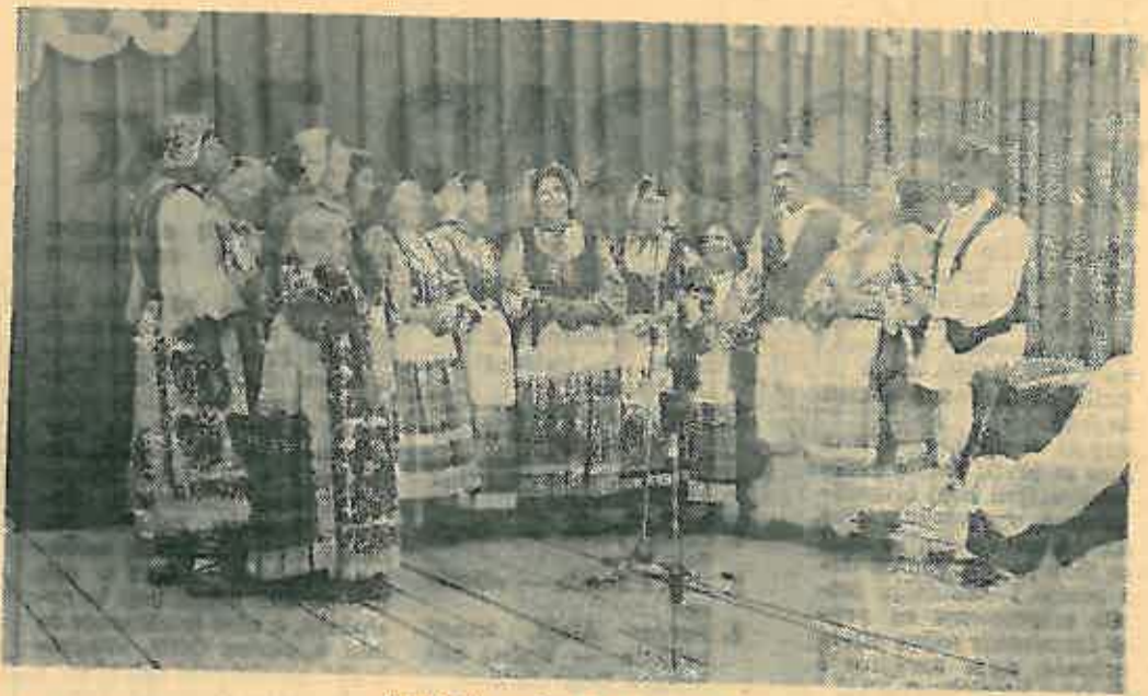
KUD »Posavka« iz Oborova