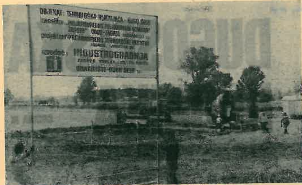
Još jedno gradilište u Dugom Selu je otvoreno