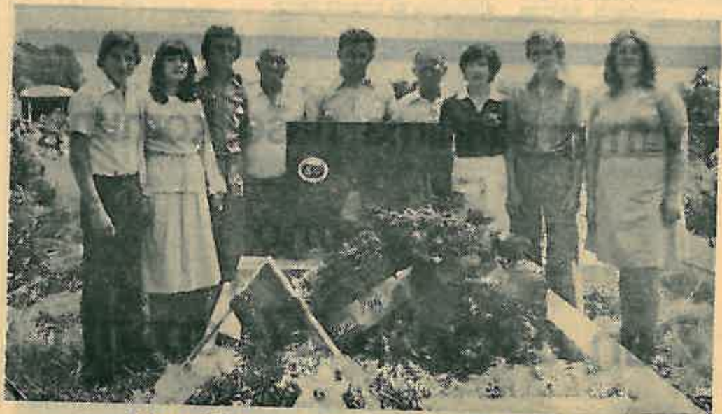
Oni su položili vijence na spomenike palih revolucionara