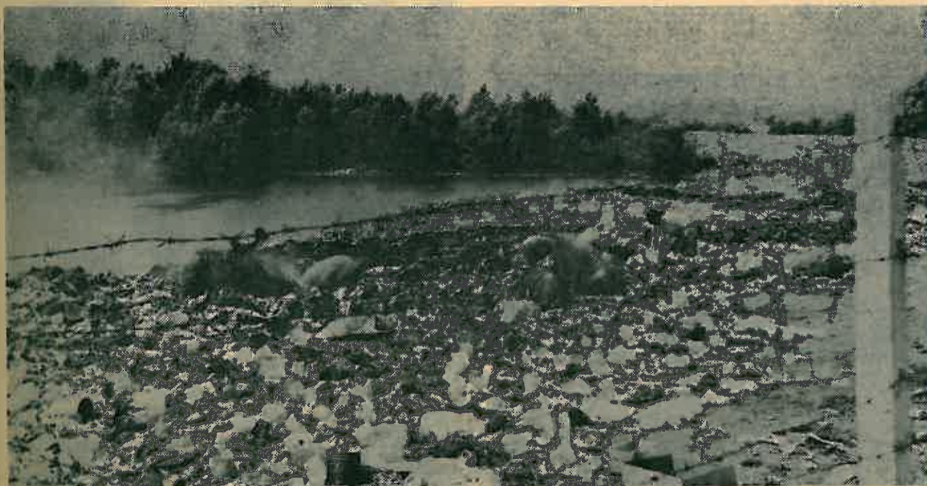
Tako se zagađuje Sava. Tko snosi odgovornost?