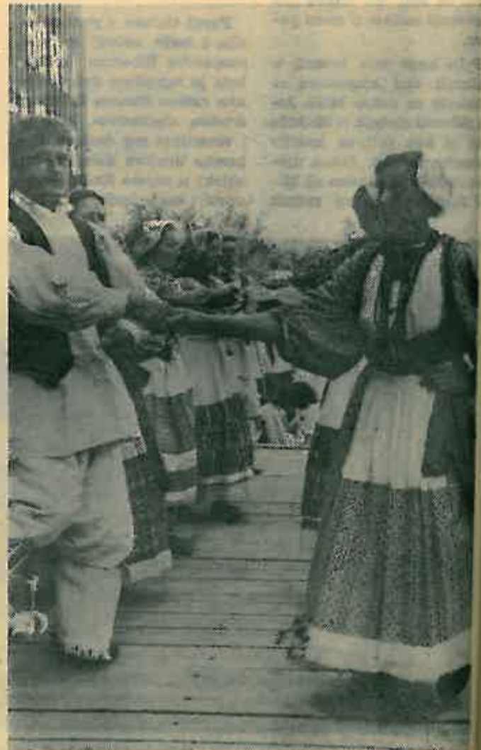
Na pozornici je bilo vrlo živo...