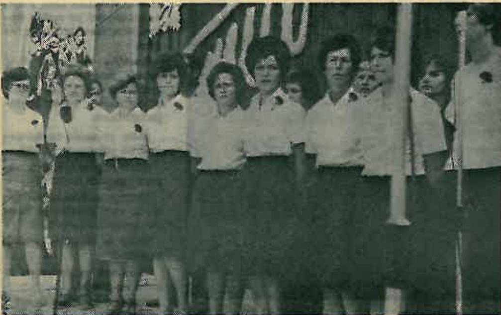
Zbor »Preporoda« prije nastupa