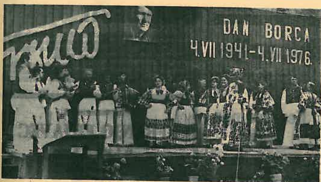
Seljačka sloga iz Lupoglava na pozornici