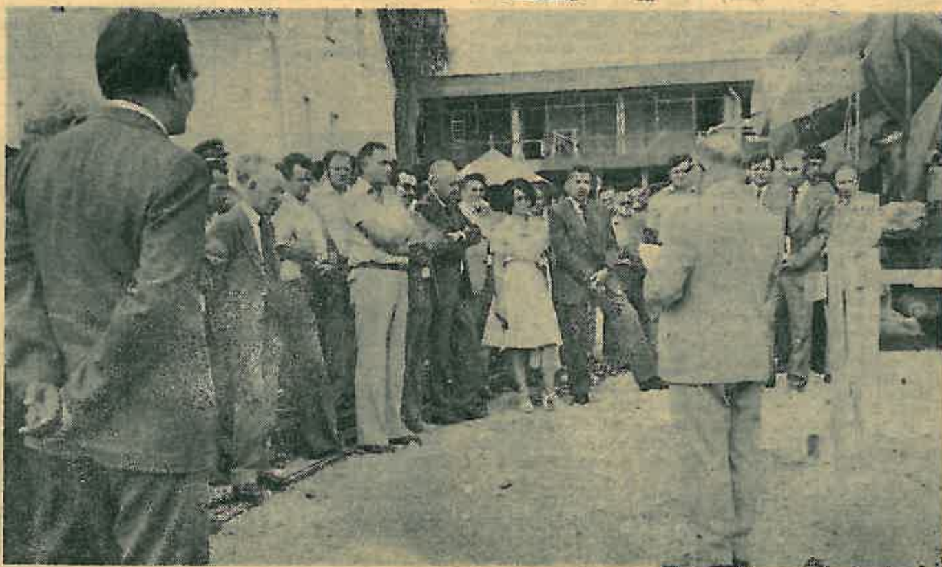
Svečano polaganje kamena temeljca za novu poštu