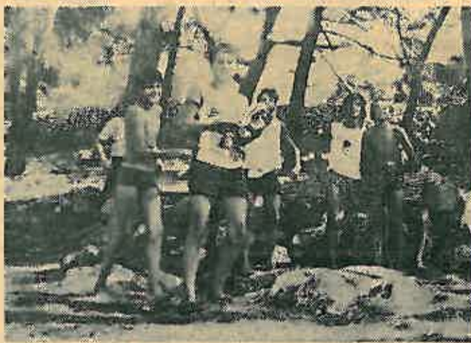
Grupa učenika na otoku Lošinj