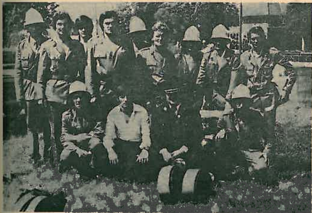
DVD Crnec već dvije godine za redom osvaja prvo mjesto na općinskom takmičenju