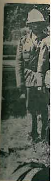
DVD Crnec v