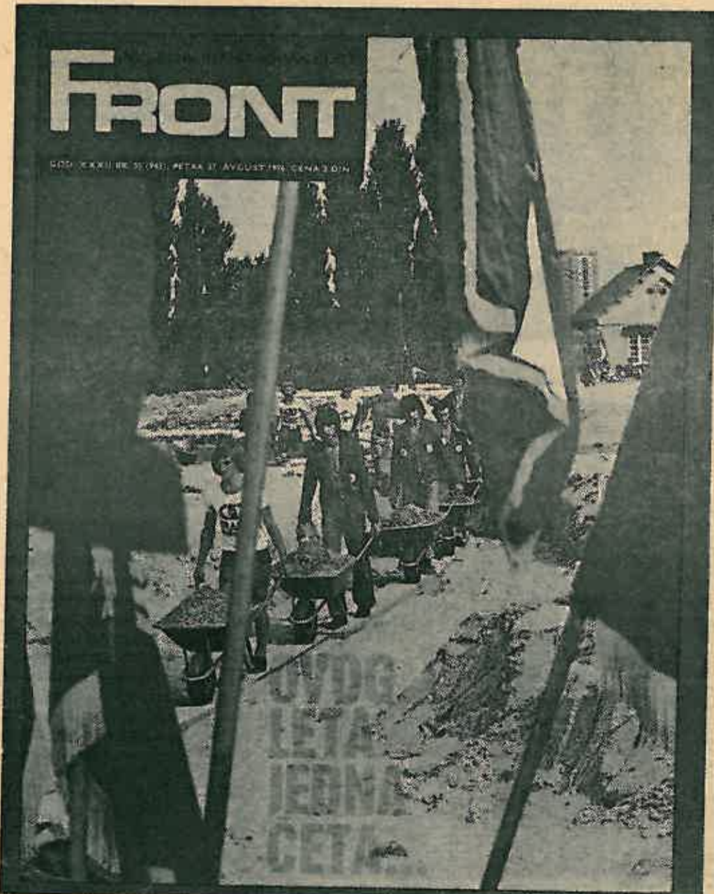
Na naslovnoj stranici Fronta snimljeni su naši brigadiri na radnoj akciji Beograd 76