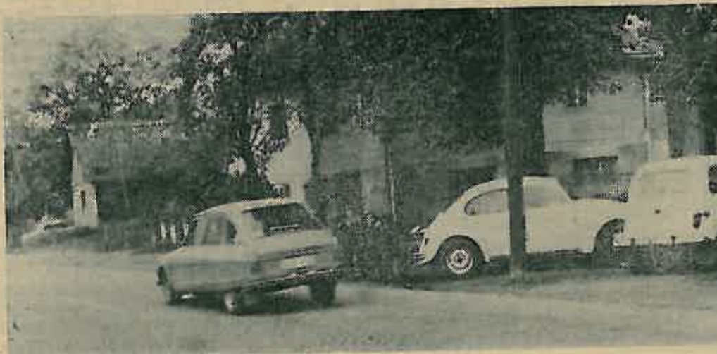
Dok su automobili parkirani na pločniku, djeca se izlažu jurećim automobilima na cesti. Da li bi u slučaju nesreće pokraj parkiranih automobila, odgovornost snosili i vlasnici parkiranih automobila. Lijevo