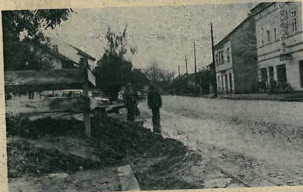
Kod pojedinih građevina, kao ova kod nove banke, pločnik je u potpunosti zauzet tako da treba prijeći na cestu. Lijevo.