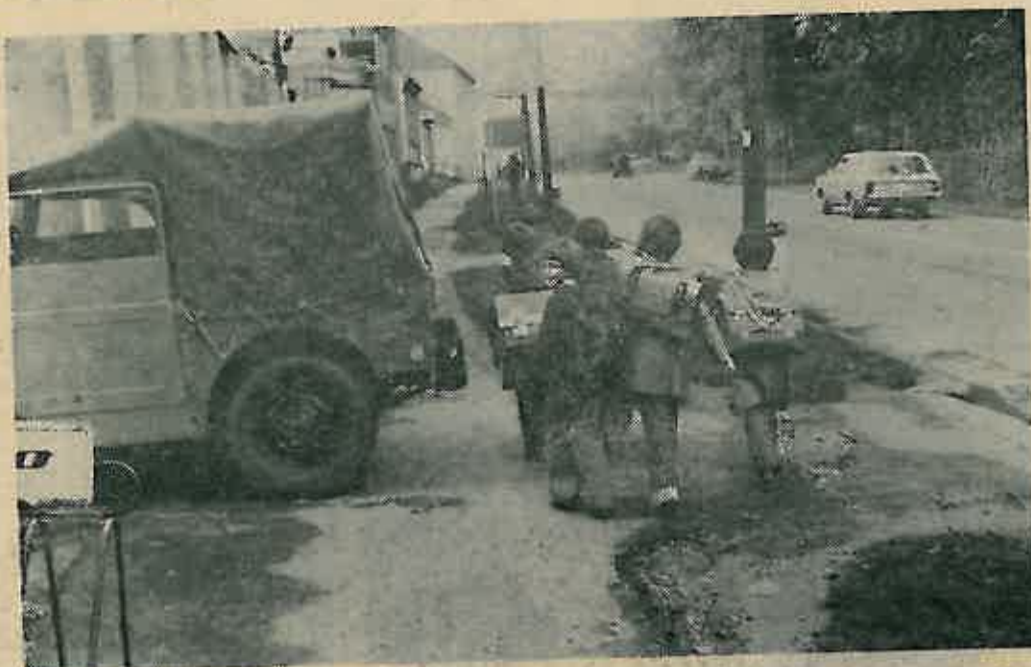
Na mnogim mjestima na pločniku su parkirani automobili, koji onemogućavaju normalan promet. Lijevo.