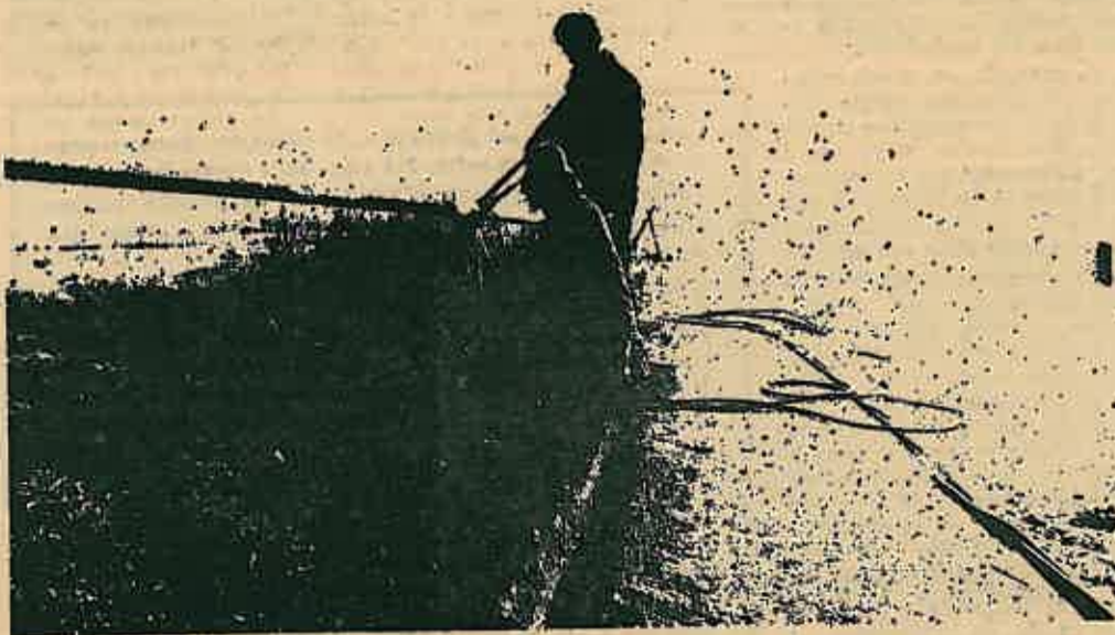
Rano ujutro, dok je još naselje bilo zavijeno maglom, dva radnika Kongrapa bila su već na svojem radnom mjestu.

Dva rovokopača i dvadeset pet do tridesetak ljudi svaki dan su na poslu i velika je šteta što ti radovi nisu započeli ranije još početkom srpnja, jer ovaj raskvašeni teren onemogućava normalno napredavanje radova.