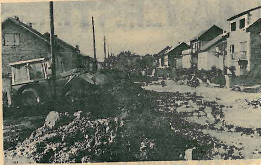
Novo naselje pretvoreno je u jedno veliko gradilište, što najbolje prikazuje ova slika. Ulicama je teško prolaziti, ali građani sve hrabro podnose jer su svjesni što im ti svi radovi donose za standard.