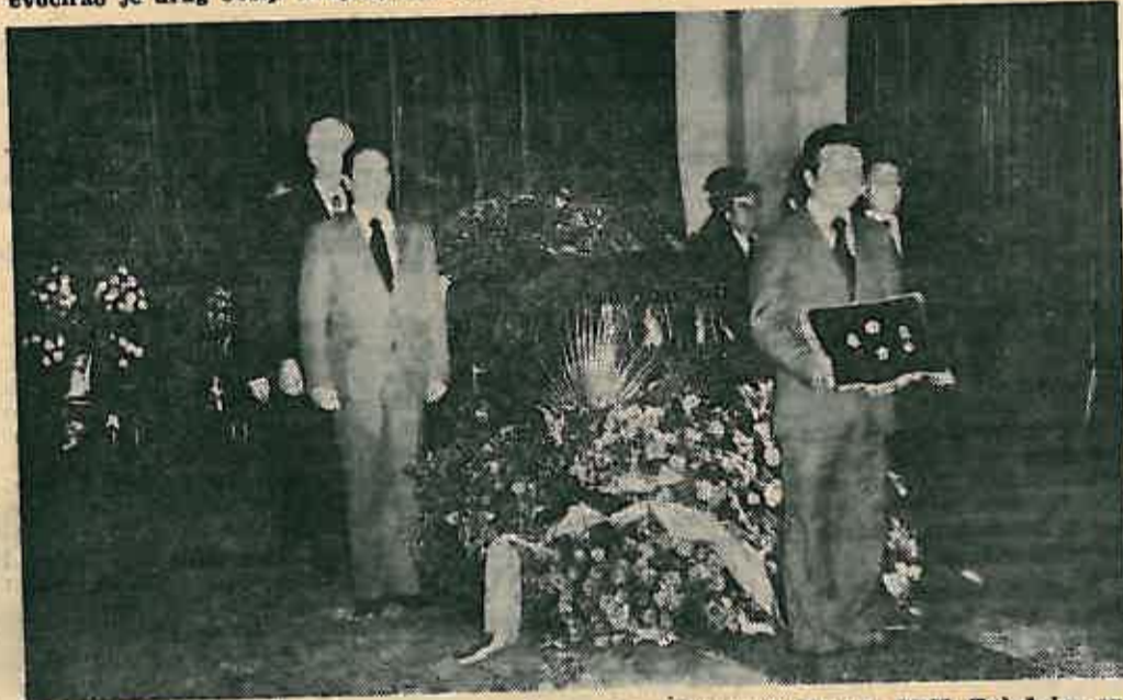
Posljednja počasna straža bila je sastavljena od predstavnika Sabora SRH, Zajednice općina Zagreb, Gradske zajednice općina i Radne zajednice u Saboru SRH gdje je preminuli bio na odgovornoj dužnosti.