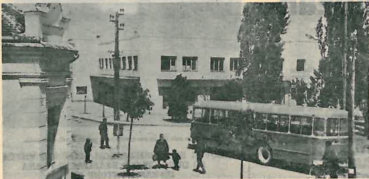
Mionica — centar grada

Počeli smo objavljivati povjesna obilježja mioničkog kraja što ćemo nastaviti i u nekoliko slijedećih nastavaka.