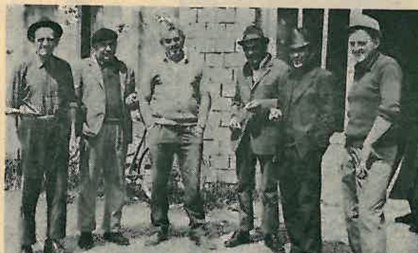
Oni su nosioci svih društveno-političkih aktivnosti u Oborovskim Novakima

750 litara mlijeka dnevno se isporučuje Zagrebačkoj mljekari. Da bi došli u Oborovske Novake potrebno je iz Dugog Sela krenuti cestom prema autoputu i Rugvici, a onda po novoj cesti Posavskog partizanskog odreda ubrzo se dolazi u selo vrijednih stočara i pjeskara.