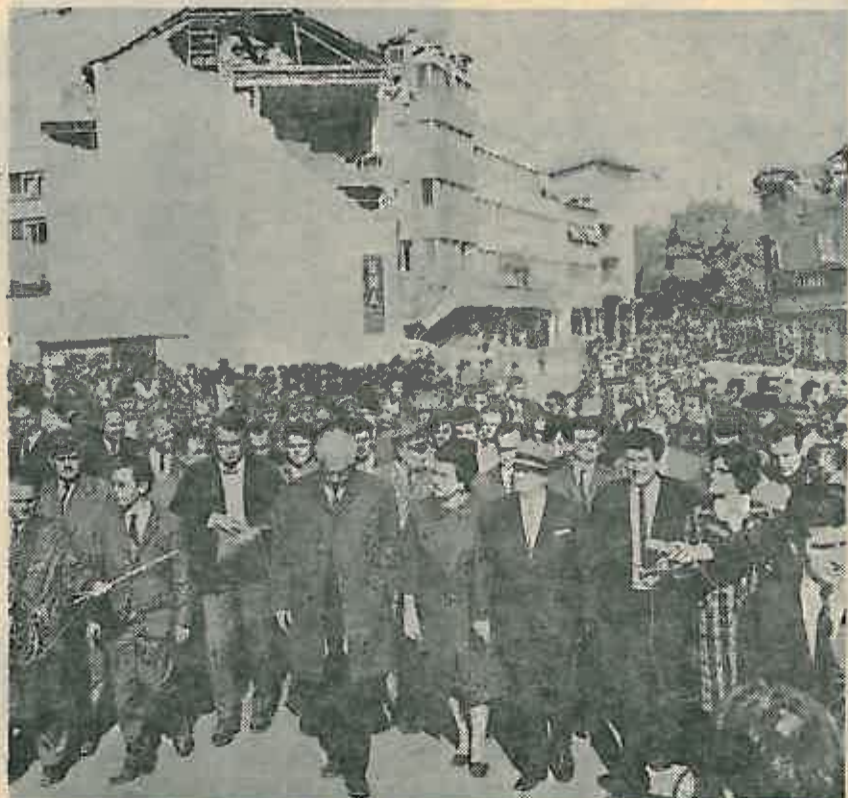
Uvijek s narodom: u Banja Luci porušenoj potresom, 29. 10. 1969. g.