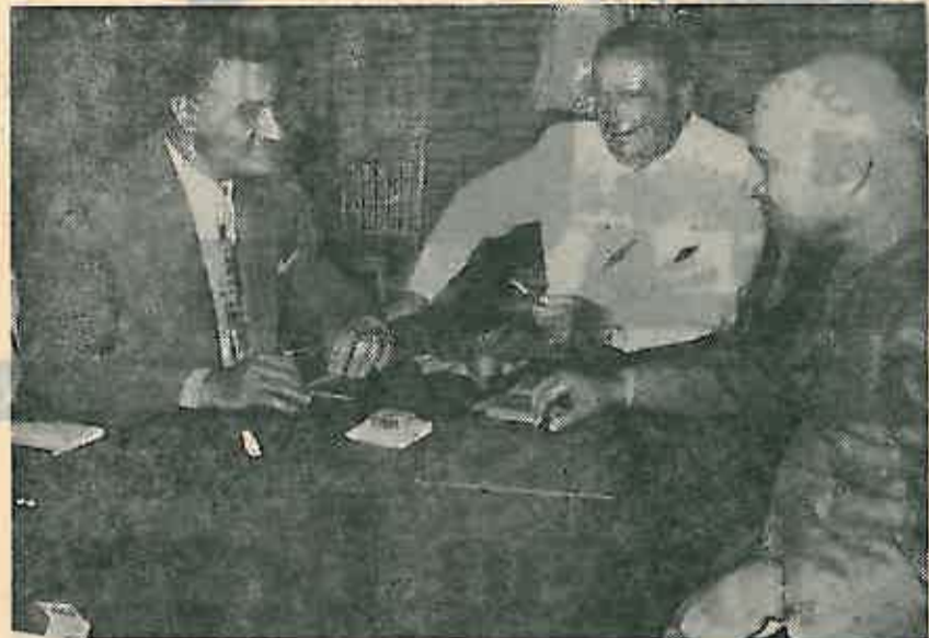
Trojni sastanak na Brionima bio je jedan od mnogih susreta tri velika boreca za bolji svijet, Nehrua, Tita i Nasera

U potvrdu veličine Titove ličnosti, mogli bismo navesti mnoštvo izjava najistaknutijih svjetskih političkih, društvenih i kulturnih imena, no jedna nam se čini u ovom trenutku, uz dužno poštovanje prema ostalima, možda najsimpatičnija, a to je izjava američkog književnika Howarda Fasta: »Tito nije stupio na pozornicu javnog života kao Roosevelt, Churchill ili Staljin. Ovi posljednji bili su poznati kao državljani mnogo godina prije nego što su postali ratni rukovodioci. Tito je izbio na površinu iz dubine neodoljive težnje Jugoslavije za slobodom, iz njedara njene potreme historije pune borbi, nacionalnog ugnjetavanja, unutrašnjih razmirica, da bi ujedno svoj narod i poveo ka slavi.« (2)