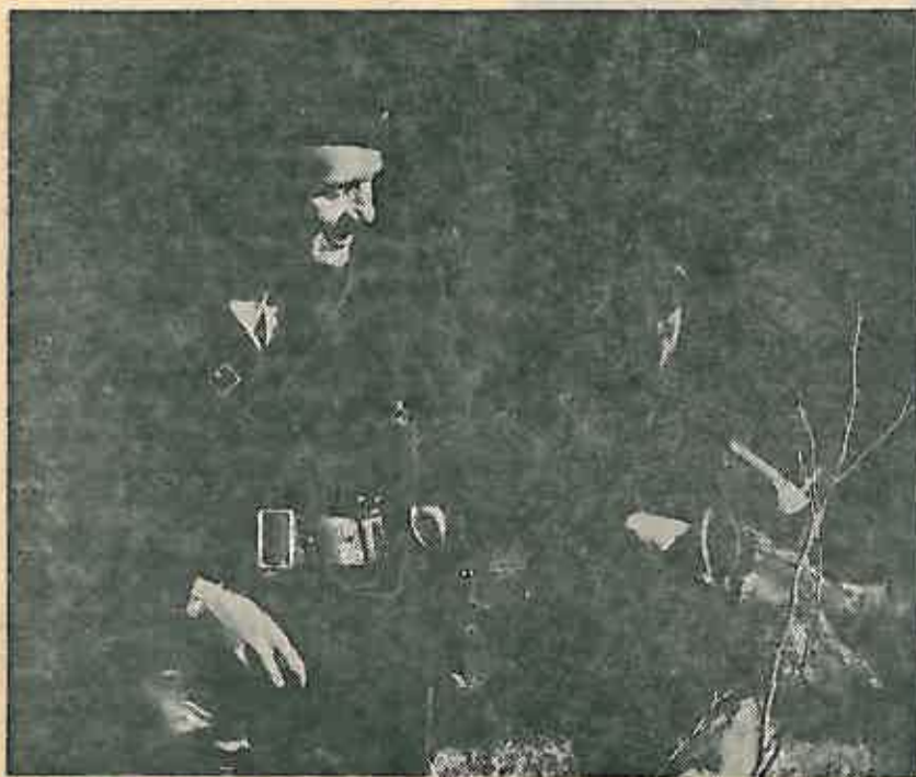
Revolucija je planula s Titom na čelu Partije i narodne vojske