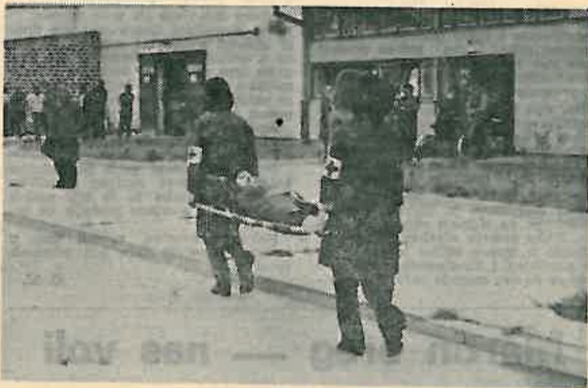
Sanitetska ekipa »Gorice« u akciji

ne organizacije i teže bolesti. Dovoljno je telefonski ili drugačije o tome obavijestiti industrijskog liječnika, obavezno se javiti mikrorajonskom liječniku, a kasnije svojem industrijskom liječniku.