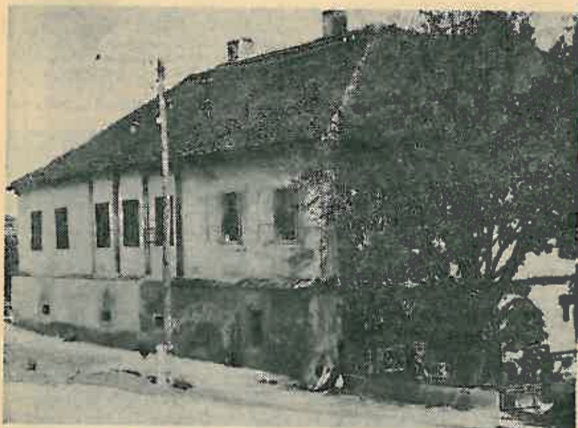
Kuća stara 400 godina u Oborovskim Novakima