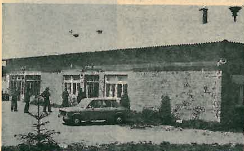
Društveni dom u Oborovskim Novakima sagrađen vlastitim sredstvima