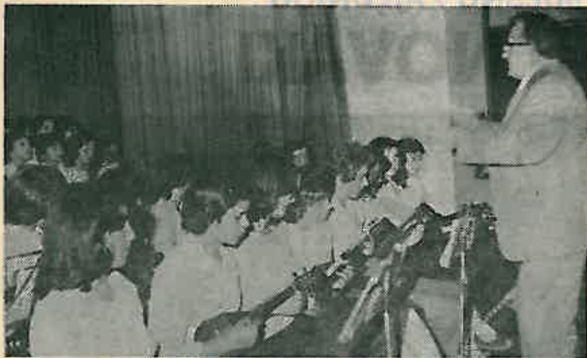
Tamburaški zbor O. S. Rugvica, nastupio je u okviru kulturno-umjetničkog programa na pionirskom takmičenju