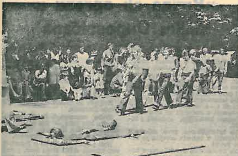
Mi krećemo na najteži zadatak — pomoći čovjeku

Ekipe PCK Dugo Selo — VII b razreda krenula je na Međuopćinsko natjecanje ekipa prve pomoći u Krapinu 29. 5. 1977. puna optimizma, koji ju je ispunjavao do posljednjeg trenutka.