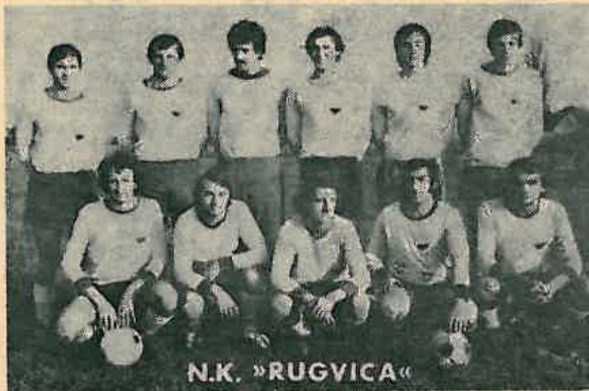
Nogometaši Rugvice — nogometni entuzijasti