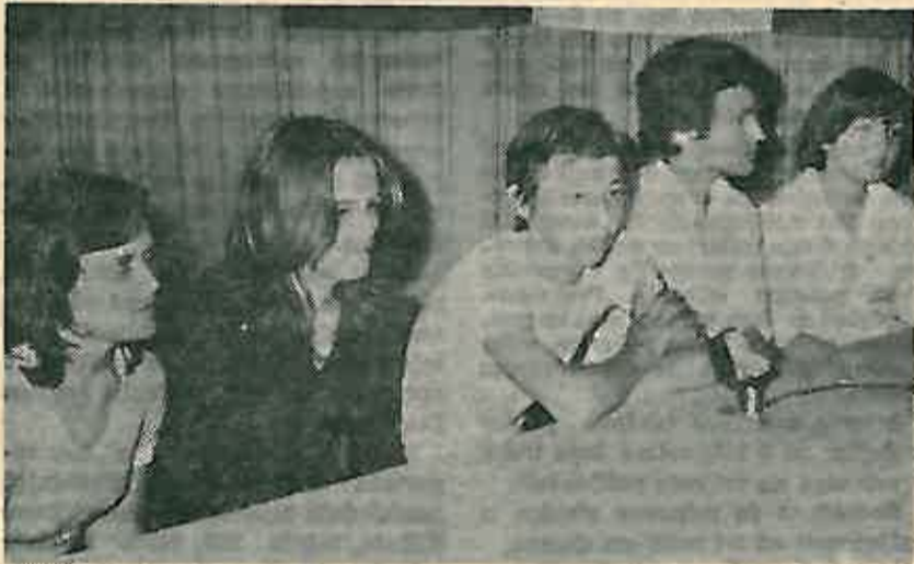
Grupa takmičara sluša postavljanje pitanja na Pionirskom kvizu