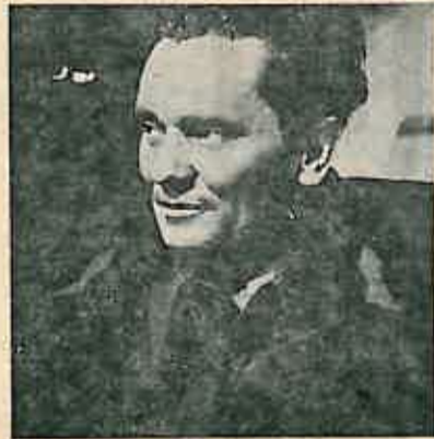
Tito — snimak iz 1943. godine

Tako nova Jugoslavija sve više skreće na sebe pažnju čitavog svijeta. No, i na međunarodnom planu Titova nesvrstana politika dobiva sve više zagovornika i afirmira se kao originalna politika čiji je cilj ravnopravna suradnja, samostalnost, nezavisnost i mir među narodima.