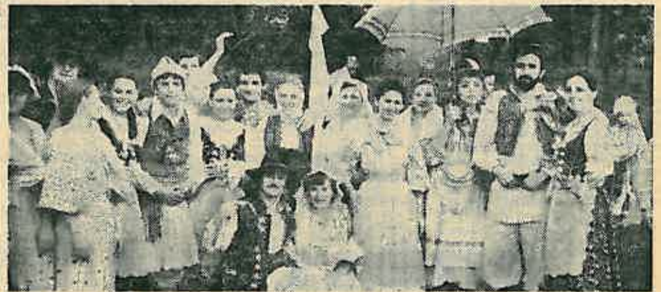
Na slici: folklorna sekcija »Preporoda« koja je 1979. nastupila na međunarodnom festivalu u Zakopanima

Početkom 70-tih godina počinje neprekidni