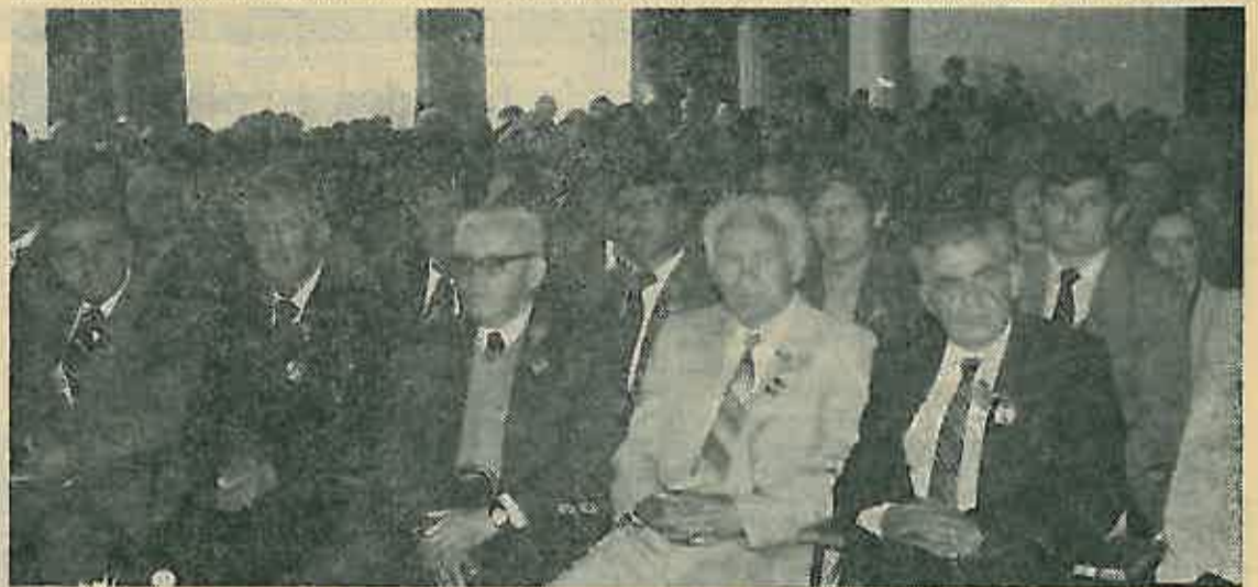
Na slici: svečana sjednica Općeg sabora Dugog Sela