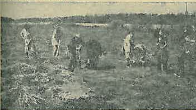
Na slici: učenici Osnovne škole «Stjepan Bobinac-Sumski» pošumljavaju predjele «Pusti črei» kraj Prečeca

U ovogodišnjoj proljetnoj akciji pošumljavanja «osvojeno» je 20 novih hektara pašnjaka i šumskih čistina na području Prečeca, Lupoglava i Vugrova. Posadeno je oko 80.000 sadnica joha, jase-na, briša i bora. (S. I.)