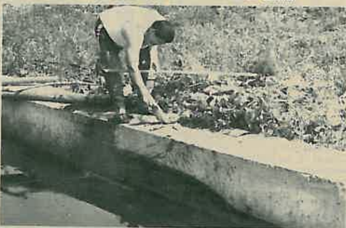
Vađenje uginulih riba - tužan prizor na našim vodotocima

14. studenog, 10.00 sati: PORIBLJAVANJE II