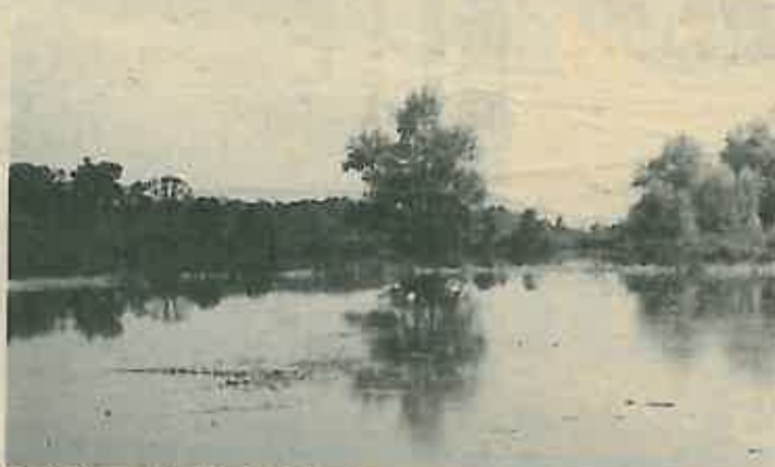
Poplavljeno mrijestilište iz kojeg je "isteklo" oko tisuću šarana.

21. VI, 28. VII, 20. IX, 4. X i 25. X: radne AKCIJE - 7.00 sati