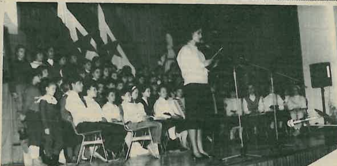
Sa svečanosti u Domu JNA