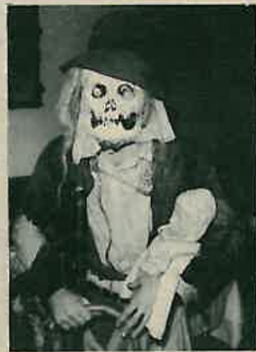
Maska: naša bolja budućnost