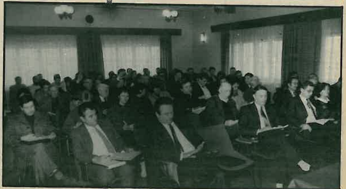
Delegati i gosti Konferencije

Zaključci konferencije, koje će izraditi Komisija, obavezuju cjelokupno članstvo Saveza komunista naše općine. (Opširniju informaciju o radu Konferencije objavljujemo na 2. stranici). Vlasta Vidović