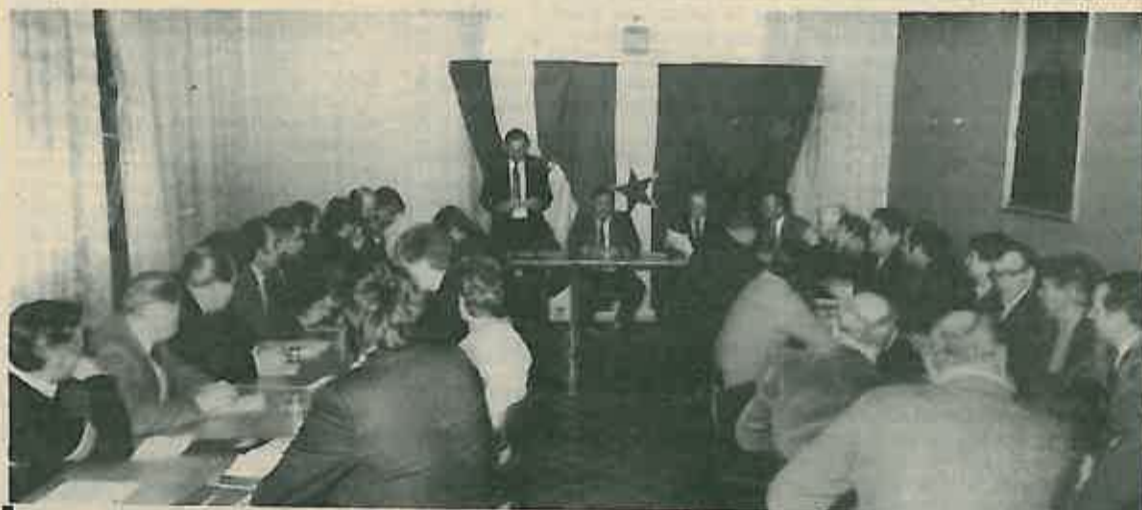
Rezervne vojne starješine na okupu