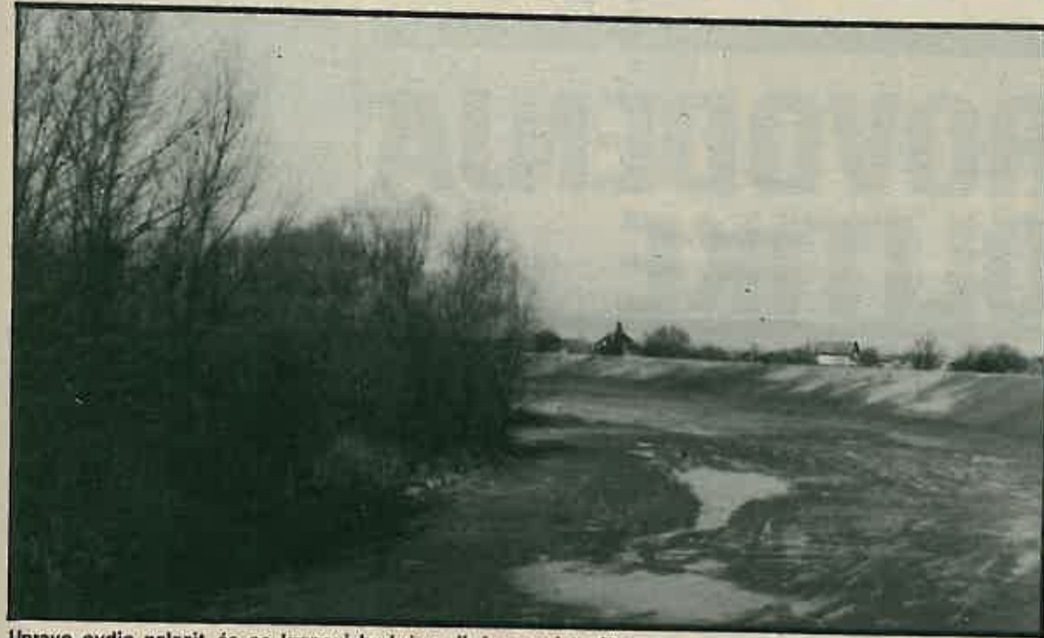
Upravo ovdje nalazit će se kranovi budućeg riječnog pristaništa

Nakon održane svečanosti slijedi narodno veselje, uz ugostiteljsku ponudu.