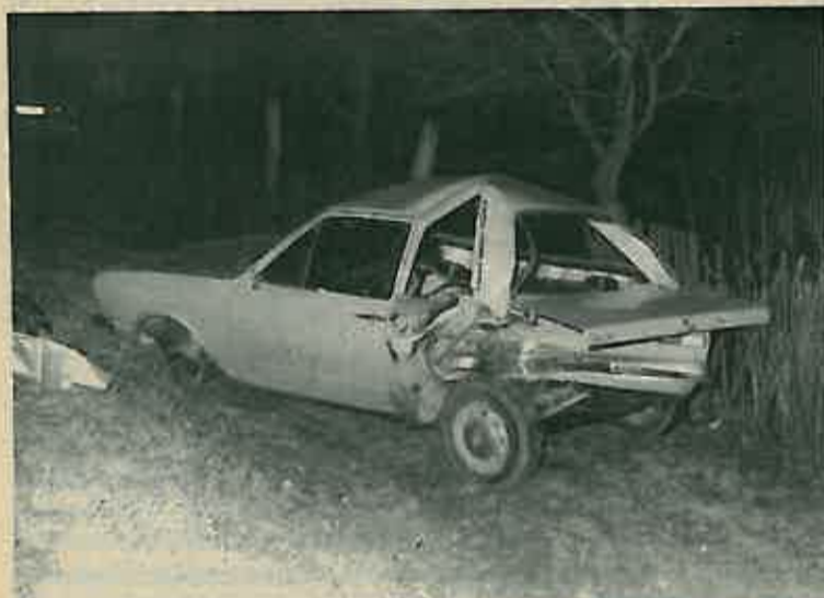
Vozilo pored kojega je poginuo njegov vlasnik