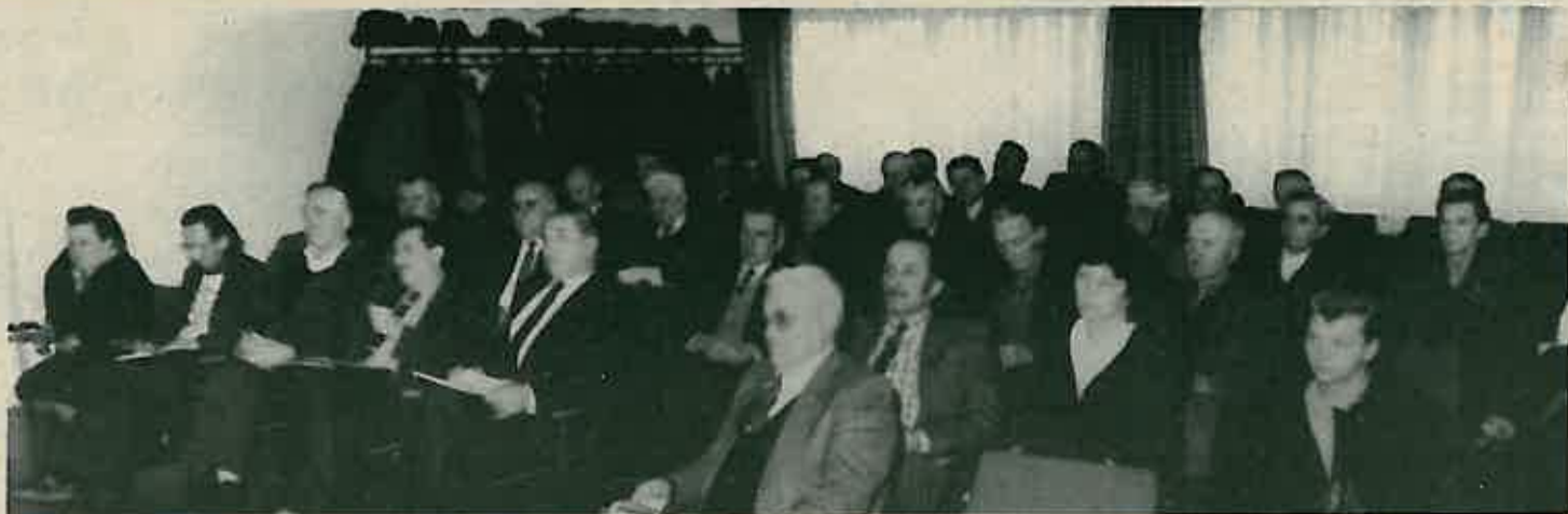
Sa izvještajne sjednice OO SUBNOR-a

Grubo narušavanje normi socijalističkog morala i društvena obezvrijeđenost rada osnovni su uzroci aktualnog kriznog stanja u društvu. Gdje naći izlaz? Da li vraćajući se na stare metode djelovanja ili hrabrije prihvaćati nove oblike?