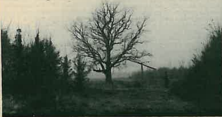
Dvije pjesme IVANA ČESKOVIĆA iz Prevlake: