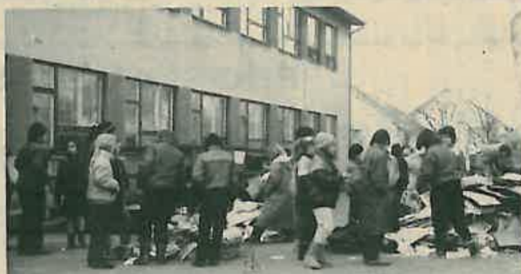
Ojda - ojda - koliko papira!