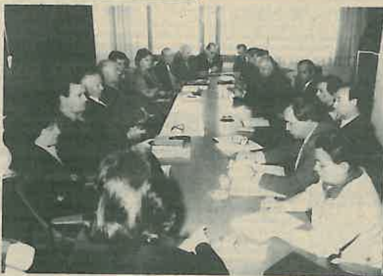
Sudionici rasprave o inicijativi MZ Ivanja Reka

Početkom ožujka održan je Dugom Selo sastanak najviših predstavnika općina Peščenica i Dugog Sela i mjesne zajednice Ivanja Reka. U raspravi su sudjelovali i predstavnici organa Socijalističkog saveza Grada i ZOZ-a. Tema sastanka bila je nastojanje MZ Ivanja Reka da se izdvoji iz sastava općine Dugo Selo i uđe u sastav općine Peščenica. Sva ta aktivnost oko izdvajanja Ivanje Reke traje već tri godine, od kada je održan referendum u toj MZ, u kojemu se većina građana izjasnila za izdvajanje. O toj inicijativi provedena je lani rasprava u svim MZ na području općine. Zaključak te rasprave bio je ne dozvoliti izdvajanje. Na tom sastanku predstavnici MZ nisu odstupali od svojih stavova pozivajući se da ih na to obvezuje provedeni referendum. Predstavnici općine Dugo Selo nisu odstupali od svojih zaključaka, jer ih na to obvezuje provedena rasprava i zaključci Skupštine općine. Prijedlog predstavnika općine Dugo Selo da se još jednom pretrpese u sklopu ostajanja te MZ u sastavu općine Dugo Selo nisu prihvatili predstavnici Ivanje Reke, s obrazloženjem da time općina samo želi dobiti na vremenu i rješavanje njihovog statusa oduljiti u nedogled. S obzirom da je i nakon četiri sata sve bilo kao i na samom početku rasprave jedini izlaz nađen je u tome da se prepusti Saboru SRH, u čijoj je i nadležnosti izmjena granica općina, da on svojom odlukom presudi.