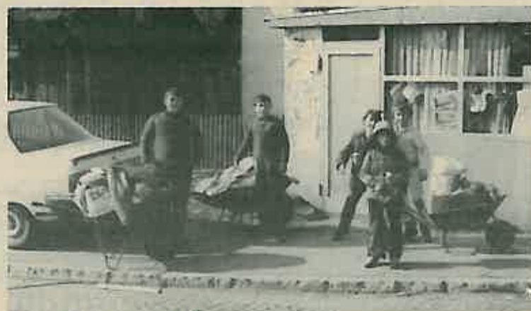
Ruke očito preslabe za tolike kilograme