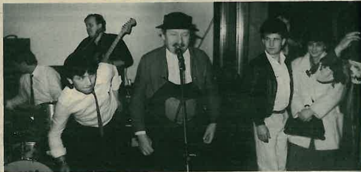
Umjesto da prepoznaju sebe u Dudeku mnogi su prepoznavali druge

Dugoselska glasilo društveno-političkih organizacija općine Dugo Selo kronika