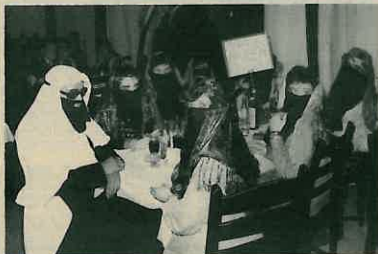
Harem: šejk i šest djevica

Pravilo u svemu je da nema nikakvih razradenih pravila. Sve se to izvodi kako kome, kakve tko ima prijatelje. Ima i slučajeva da se umjesto perja koristi i piljevina, ili se pak izvede neka druga domišljatost. Sve međutim upućuje da je sva ta zmotancija usmjerena prvenstveno prema sretnom ocu, a ne toliko ni prema majci ni prema novorođenčetu.