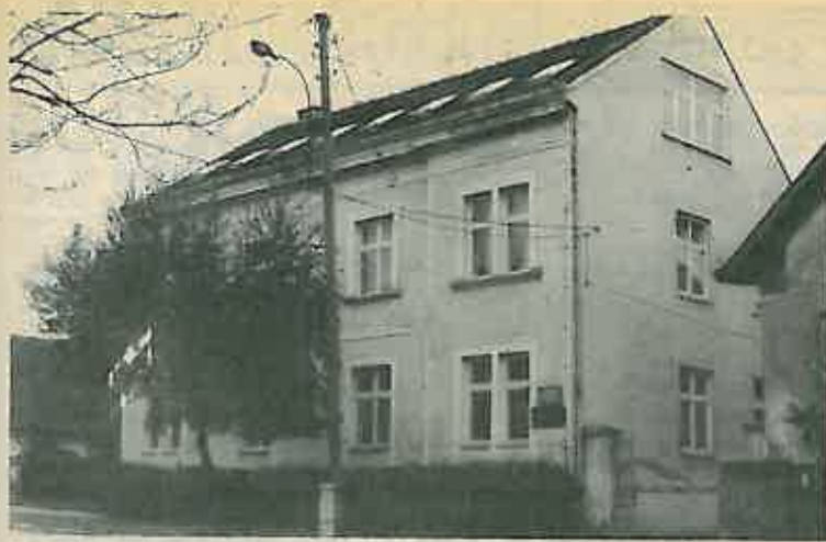
Da li mjere u RZ ipak nešto dulje?