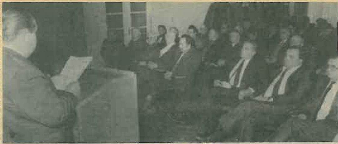
Za vrijeme svečane sjednice