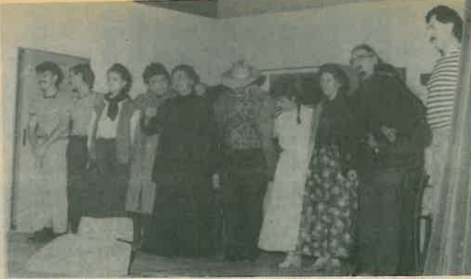
Vjerujemo da bi i pokojni Vojnović bio zadovoljan kako je prikazana njegova drama