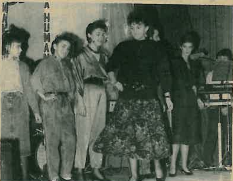
Koju haljinu i frizuru odabrati kao najljepšu?

vjerujemo vrijedne, publika nije mogla ni dobro vidjeti, a kamo li se naglo odlučiti na trošak – u ovim burnim i plivajućim vremenima našeg standarda.