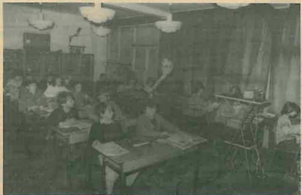
Bilježnice na pregled

»S njima nikad teško, a posvetio sam im sve ove godine, vječno tražeći nove puteve u metodi, koristeći nova sredstva, kako bih im što