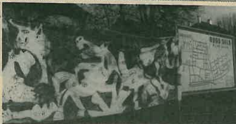
Piccasovu "Guernicu" nitko nije prepoznao