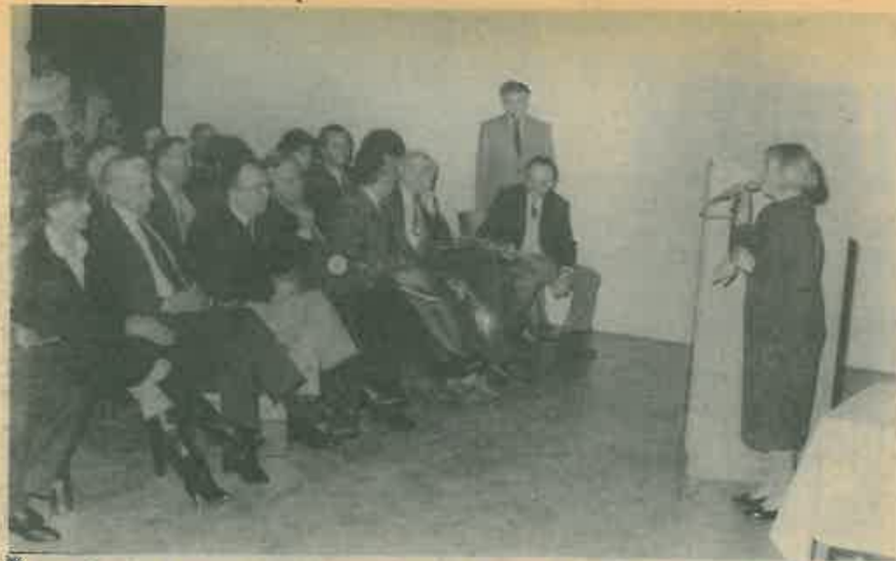
Gostima, autoru i predstavljacima knjige uručeni su prigodni pokloni

Promocijom knjige obilježen Dan prava čovjeka – 10. prosinca