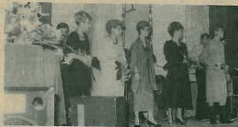
Mladost, ljepota, smijeh i vedrina