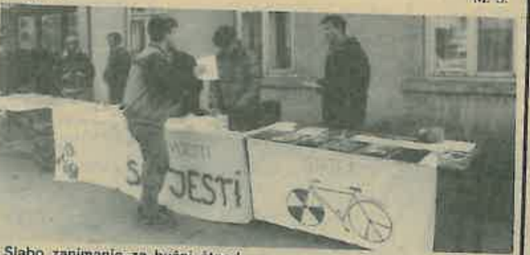
Slabo zanimanje za bučni štand