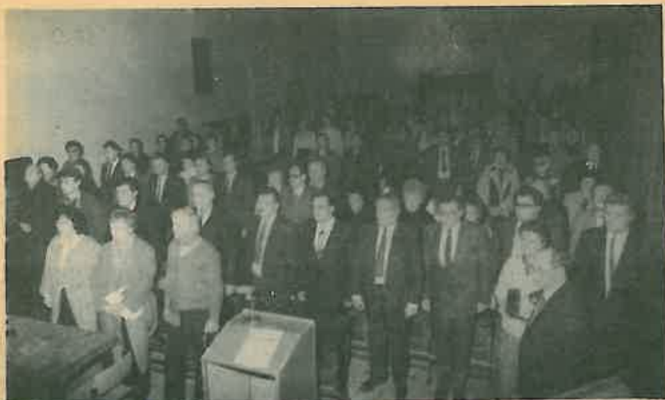
Sudionici svečane Skupštine »Preporoda«