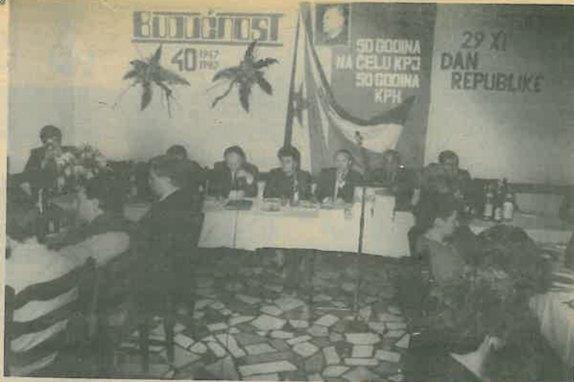
Sa prigodne svečanosti u Božjakovini

Pet godina kasnije udružuje se s Ugostiteljskim poduzećem Dugo Selo i preuzima njihovih 5 gostionica. 1973. g. otkupljuje poslovne objekte i inventar »Agrokombinata« Zagreb u Ivanju Gradu, a 1977. pre-