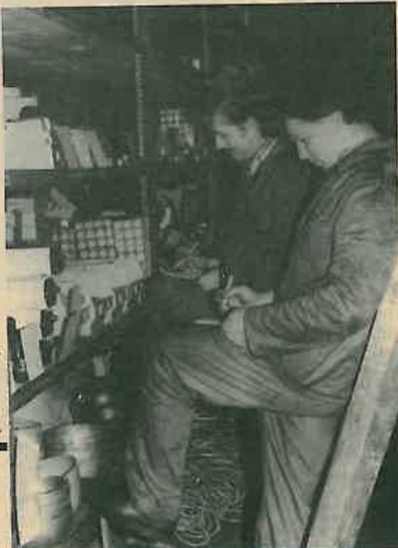
Popisne komisije započele su svojim radom

U našoj Radnoj organizaciji godinama se organizaciji godišnje inventure poklanja posebno značenje. U tu svrhu je Radnički savjet RO "Gorica",