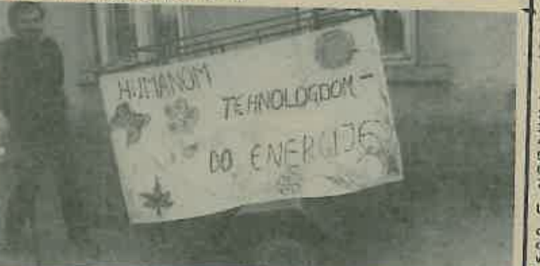
Poruka - bez odjeka