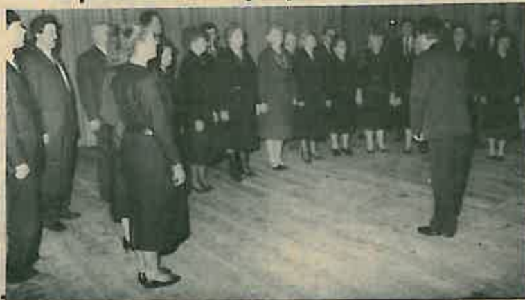
Ponovo okupljeni pjevački zbor

Preko dvjesto kulturnih amatera nastupilo u dvije večeri. Program koji nije samo zadovoljio nego i oduševio gledaoce. Želja: da to postane novi preporod »Preporoda«.