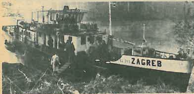
I bez pristaništa prvi brod je pristao u Rugvici

Ovih dana mjesne organizacije SUBNOR-a završavaju održavanje svojih izvještajnih godišnjih skupština pa je njihovo održavanje također bilo razmotreno.