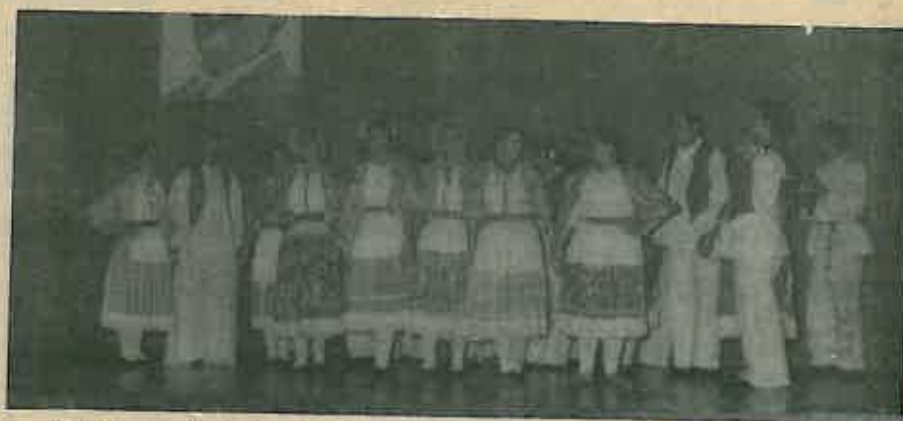
KUD Tančec koje je u kratko vrijeme napredovalo i iznenadilo gledaoce