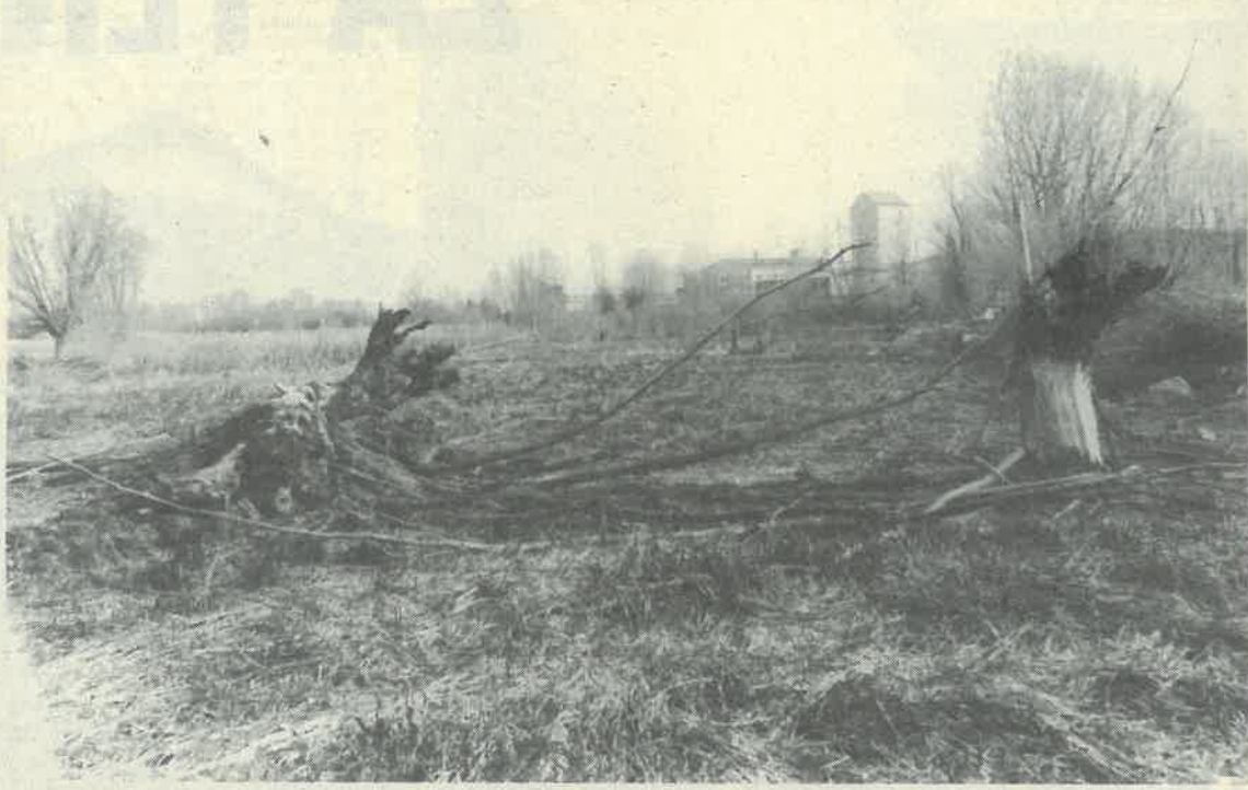
Mrtvica je spaljena, a s njom i život u njoj