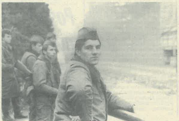
Jedan od posljednjih jugovojnika