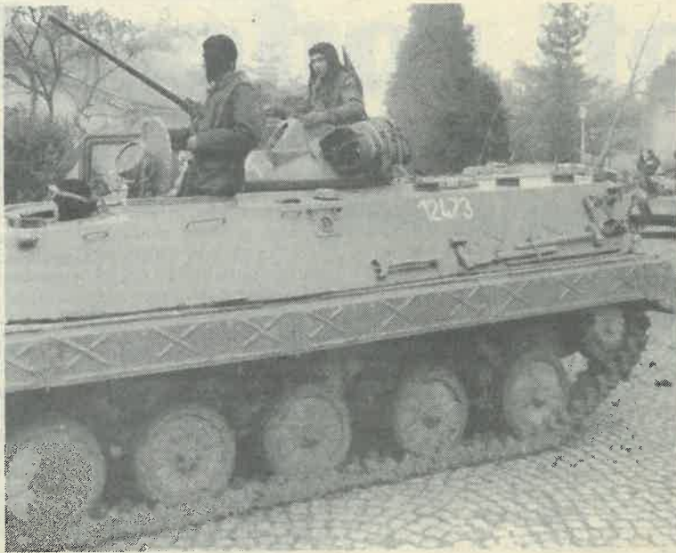
Odlazak oklopno-mehaniziranog transporta