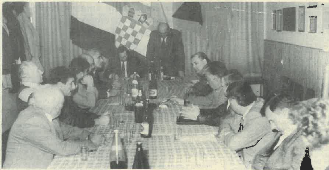
Prigodni skup obilježavanja Svjetskog dana Civilne zaštite

U vrijeme opasnosti od poplava posebno nazočne bijahu i jedinice dugoselske civilne zaštite. Po prirodi svojih zadataka Civilna zaštita trajno surađuje, a prema potrebama ta se suradnja posebno intenzivira, sa Općinskom organizacijom Crvenog križa i Centrom socijalne skrbi i drugim organizacijama. Posljednji primjer takve suradnje je popis prognanika na cijelom području općine, koju su obavili pripadnici CZ u suradnji s Centrom socijalne skrbi. Civilna zaštita je u vrijeme zračnih opasnosti brinula o skloništim, prethodno