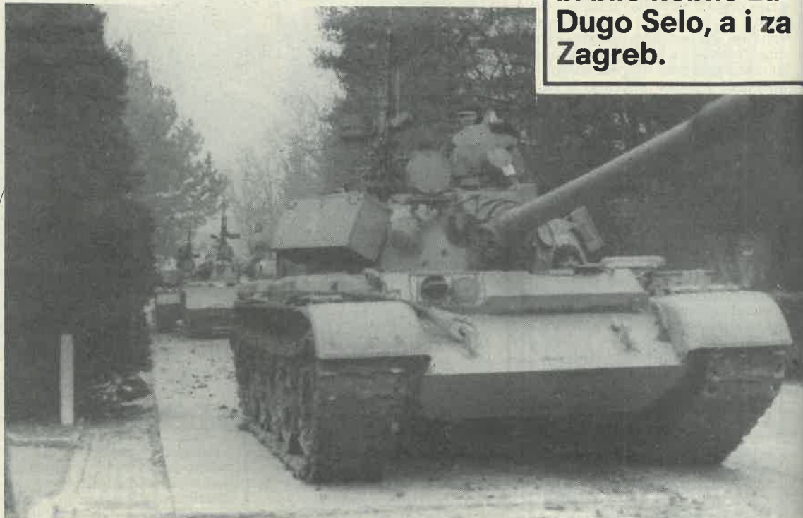
Iz dugoselske kasarne izašla je nepregledna kolona razne borbene tehnike