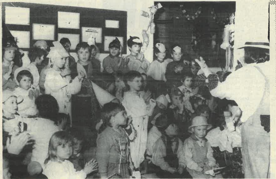
Maškare u vrtiću

Vjerojatno takav nikada ranije nije bio. Nedavno je stigao iz inozemstva pun ka-