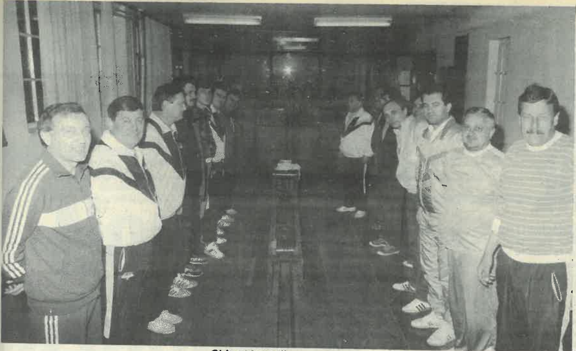
Objekcije prije početka nadmetanja