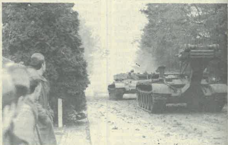
Izlazak specijalnih borbenih vozila

Istina je da možemo žaliti za tolikom vojnom tehnikom i opremom odvezenom iz Dugog Sela, no ostaje nam zadovoljstvo zbog činjenice da nitko u Dugom Selu nije izgubio život, usprkos puno naoružanja u rukama ljudi i usprkos ne male nervoze i napetosti u to vrijeme. Istodobno iz Dugog Sela otišla je vojska i njeni oficiri, koji su pri svom odlasku ostavljali dojam rastrojenih, podbuhlih i polupijanih gubitnika.