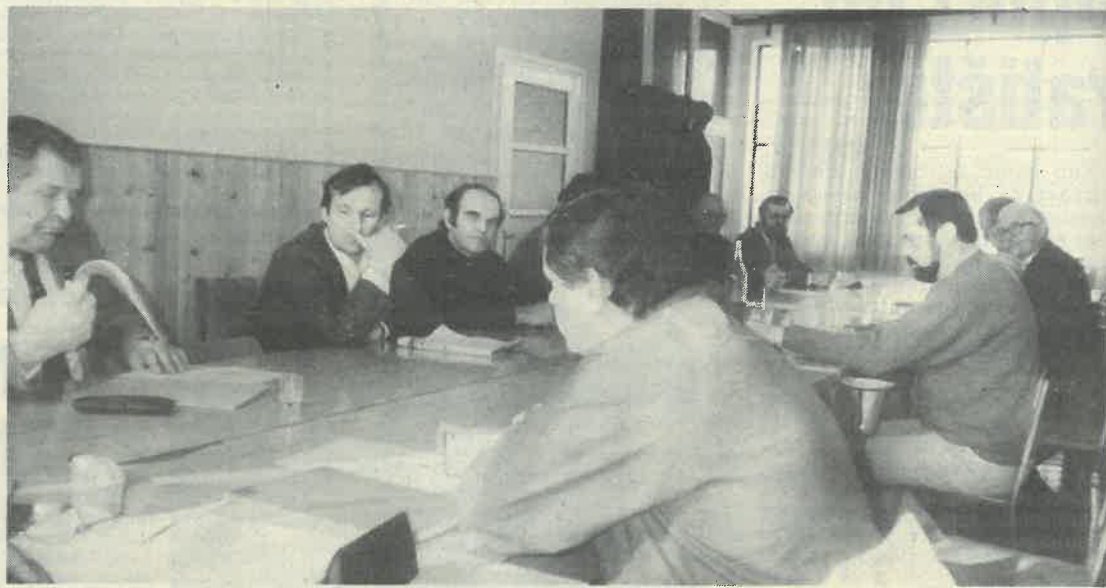
Pčelari na okupu

su svoja mišljenja primjerom zapadnih zemalja, na koje se često pozivamo, ali se rijetko kad ugledamo u njih. Razvijene zemlje ulažu u poljoprivrednu proizvodnju i proizvodnju hrane, te potiču pčelarstvo. Pčele su dobrodošle na njihove usjeve u vrijeme cvatnje radi opravljanja, čime nedvojbeno povećavaju prinose. Korist se tamo plaća, tako vlasnik pčela prema odgovarajućem proračunu dobije postotak za svoj doprinos u povećanju prinosa. Sasvim je obrnuta situacija kod nas, pa se postavlja pitanje tko radi pametnije? U svakom slučaju, bolja suradnja onih koji odlučuju o nekoj