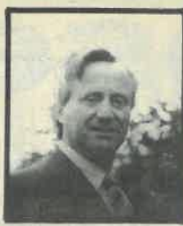
Piše: prof. Ivan Pandžić