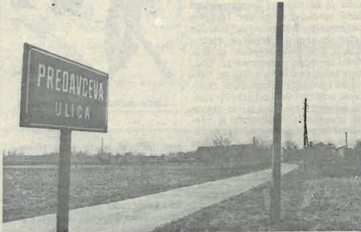
Neispravan ispis naziva u Rugvici

JOSIP PREDAVEC nedvojbeno je najznačajnija osoba hrvatske političke povijesti ponikla iz dugoselskog podneblja, točnije iz Rugvice. Predavec je bio dopredsjednik Hrvatske seljačke stranke, najjače i najbrojnije hrvatske stranke između dva rata. Usporedbe radi: HSS toga vremena bio je jedina stranka koja je u okviru ondašnje Jugoslavije zastupala hrvatske interese i njezin je utjecaj i podrška premašivao današnji primjerice, utjecaj i rasprostranjenost HDZ-a. Predavec je bio dopredsjednikom Vlatku Mačeku, a ubijen je u Dugom Selu, kao žrtva atentata nekog orijunaša i jugoslavenaša. Istodobno Predavec se kao agronom ozbiljno bavio napretkom i uspostavljanjem sustava koji bi omogućio boljitak poljoprivrede i seljaštva. Tijekom ovoga stoljeća dugog Selo nije iznjedrilo istaknutiju i povijesno zabilježenu osobu.