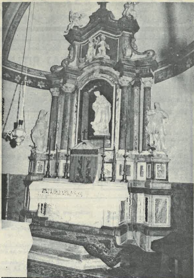
Crkva blaženog Augustina Kažotića bogata je umjetničkim i povijesnim vrijednostima. Glavni oltar bijaše prvotno raden za Zagrebačku katedralu.