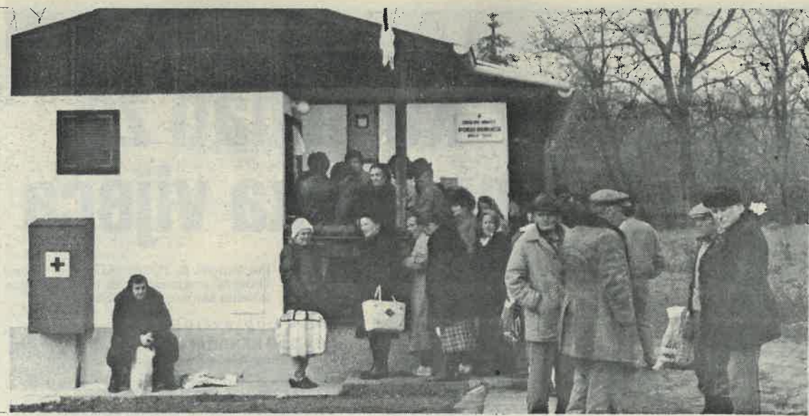
Svakodnevni prizor pred domom CK