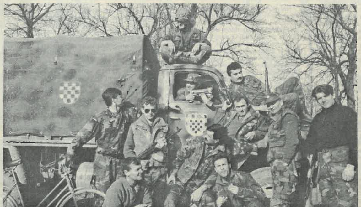
Dugoselski dragovoljci nakon što je prošlo vrijeme ilegalnosti