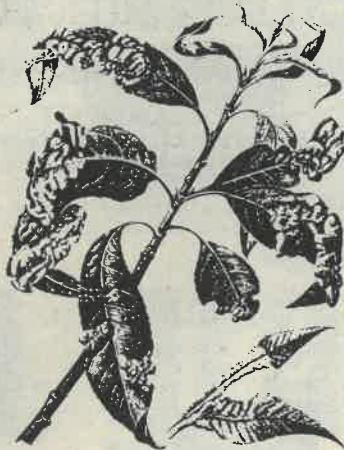
Lišće zaraženo kovrčavošću