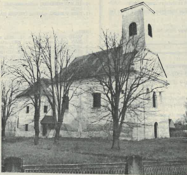
Crkva u Lupoglavu

Crkva ima namještaj uglavnom iz 19. stoljeća: bijelu propovjedaonicu s pozlaćenim ukrasima i Mojsijevim dekalogom, klupe s tragovima baroknih elemenata na pobočnim stranama, a iz doba historicizma dva pobočna oltara (1898.) s klasicističkim svjećnjacima, krstionicu s kipićem krštenja Kristova. Orgulje koje su tu bile još oko g. 1890. — prema riječima zvonara (1969) — potjecale su iz zagrebačke katedrale, kojih više ovdje nema. Najveću pažnju privlači glavni oltar umjetničko djelo osobita značenja, i to ne samo za ovaj kraj. Kameni oltar tektonski zasnovan, ukrašen crnožutom brečom ima od bijela mramora kipove sv. Augustina, čuvenog crkvenog oca, koji je kao biskup umro g. 430 u afričkom Hiponu u vrijeme kad su grad opsjedali Vandali, zatim učenog dominikanca bl. Augustina Kažotića, rođenog u Trogiru, zagrebačkog biskupa (1303—1318), koji je podlegao rani zadobivenoj od