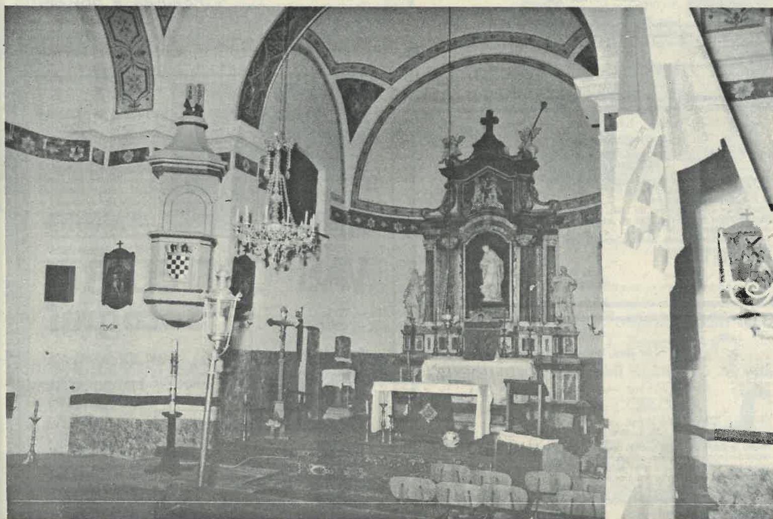
Unutrašnjost crkve današnjih dana