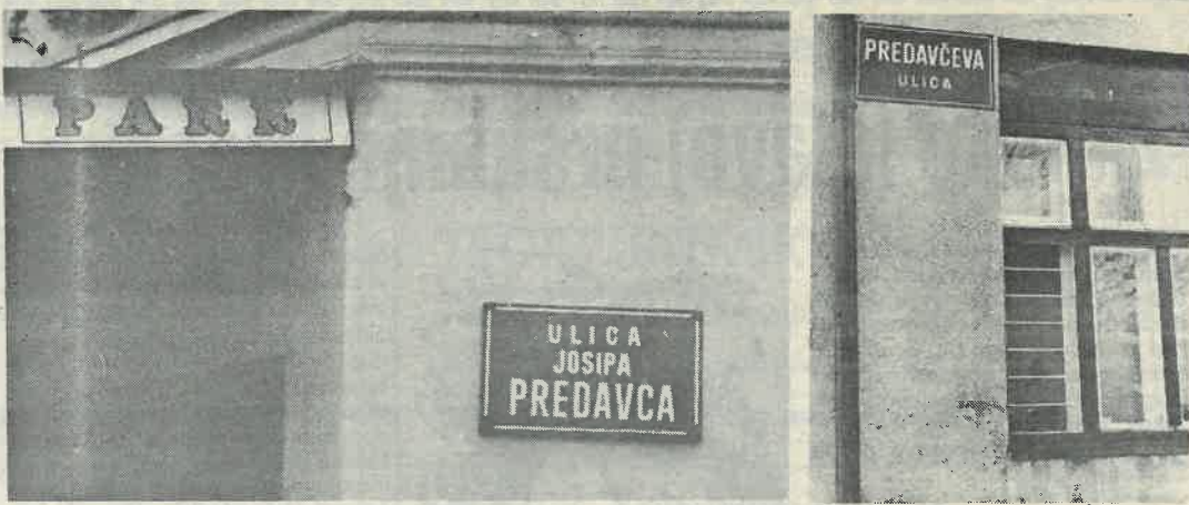
Naziv istaknut u Dugom Selu