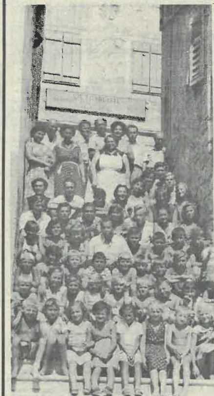
Dugoselci daleke 1957. g. ispred svog odmarališta