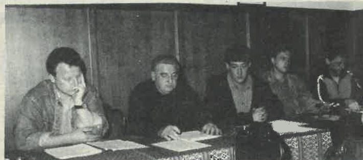
Dužnosnici starog-novog kluba