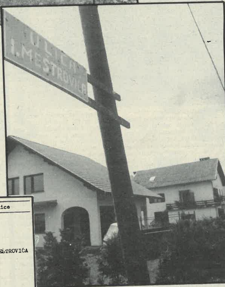
Ulomak iz Odluke Skupštine općine Dugo Selo iz 1985. g. koja je unijela zbrku

Zašto su i do kada će biti prijeporni nazivi dvije dugoselske ulice? Do kada će građani dvije različite ulice imati u dokumentima isti naziv? Tko je kriv za zbrku?