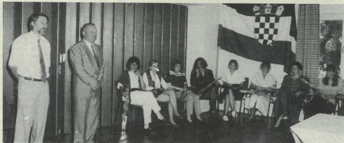
Za vrijeme prijema

Stranka HSP smatra da ima pravo iz svojih redova ponovo predložiti novog donaćelnika, a HDZ traži da njihov predstavnik zauzme tu dužnost. Kako će biti vidjet će se na jednoj od narednih sjednica Vijeća, kada će biti imenovan novi donaćelnik.