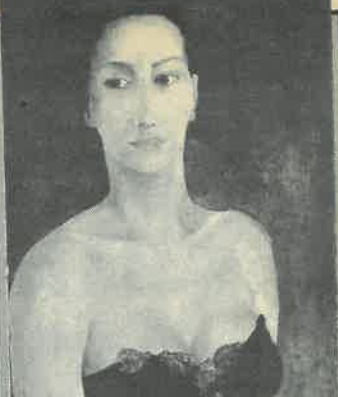
Žena — najčešći motiv Velimirovih slika

Neformalno i po dokumentima građana također Meštrovićeva ulica