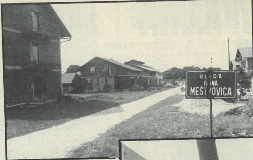
Formalno Meštrovićeva ulica