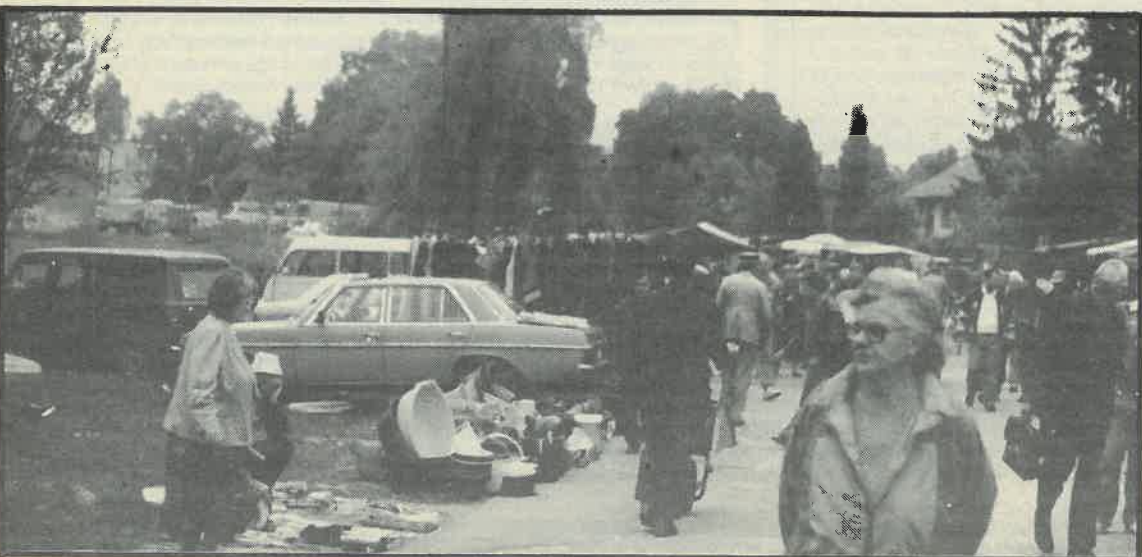
Prometnica zakrčena dugoselskim sajmom

Mi samo podsjećamo naše čitatelje da je prije godinu dana također pokušano premještenje sajma na to isto mjesto. No bez uspjeha. Nadajmo se da se neće ponoviti uobičajeno: pričalo se i najavljivalo neko vrijeme pa opet sve ostade po starom.