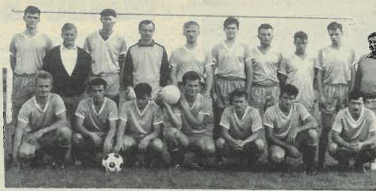
Igrači novoutemeljenog NK Ostrina