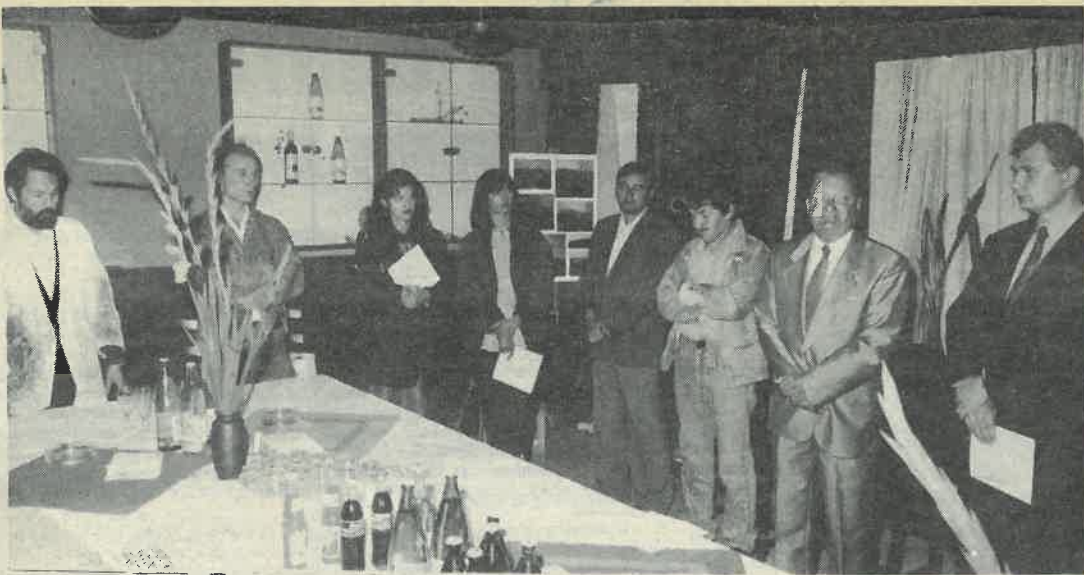
Mala svečanost početka rada kolonije održana je u Hotelu Park.