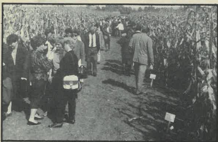
Stručnjaci na polju BC hibrida u Rugvici